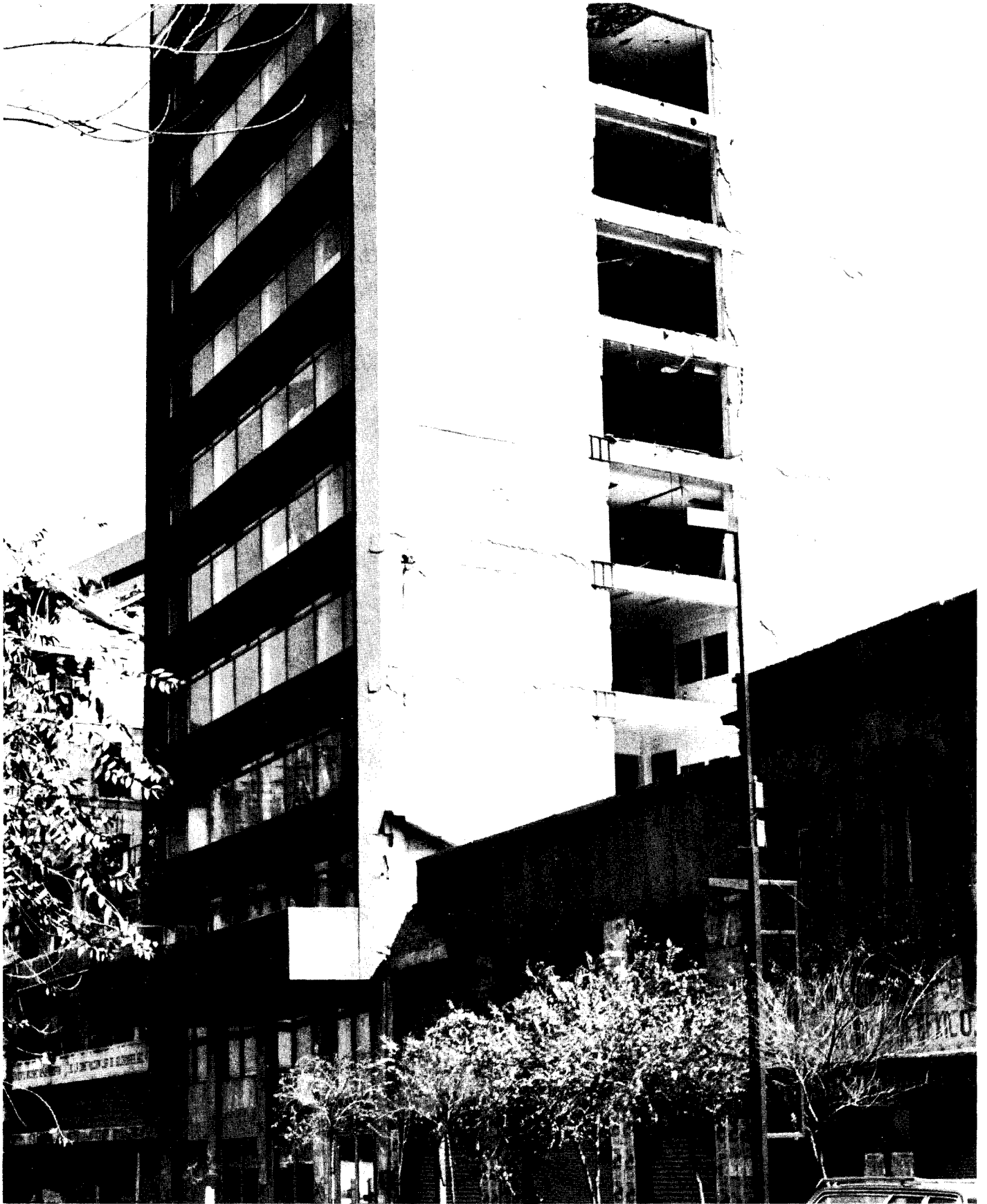
129 Edificio de las calles de Bucareli 22 y 24, Centro, después del sismo del 19 de septiembre de 1985.