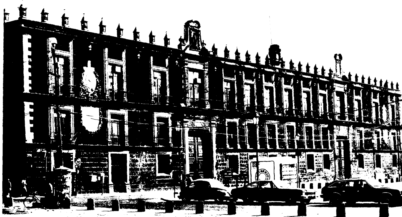
127 Perspectiva del edificio de la Antigua Aduana, en la Plaza de Santo Domingo, Centro, a donde se fueron los Juzgados de Distrito en 1951.