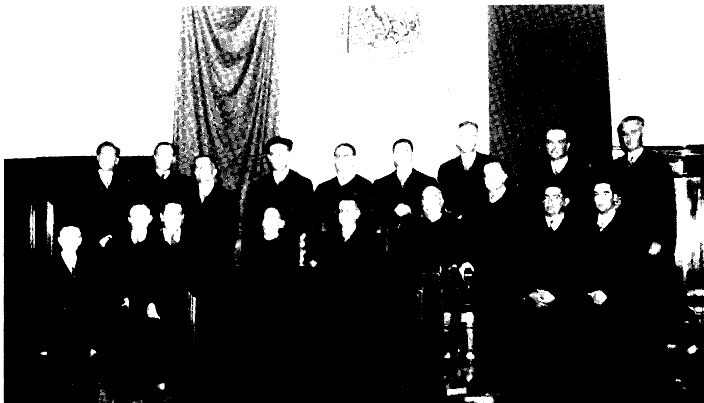
124 Fotografía oficial de los Señores Ministros de la Suprema Corte de Justicia el día de la inauguración del edificio.