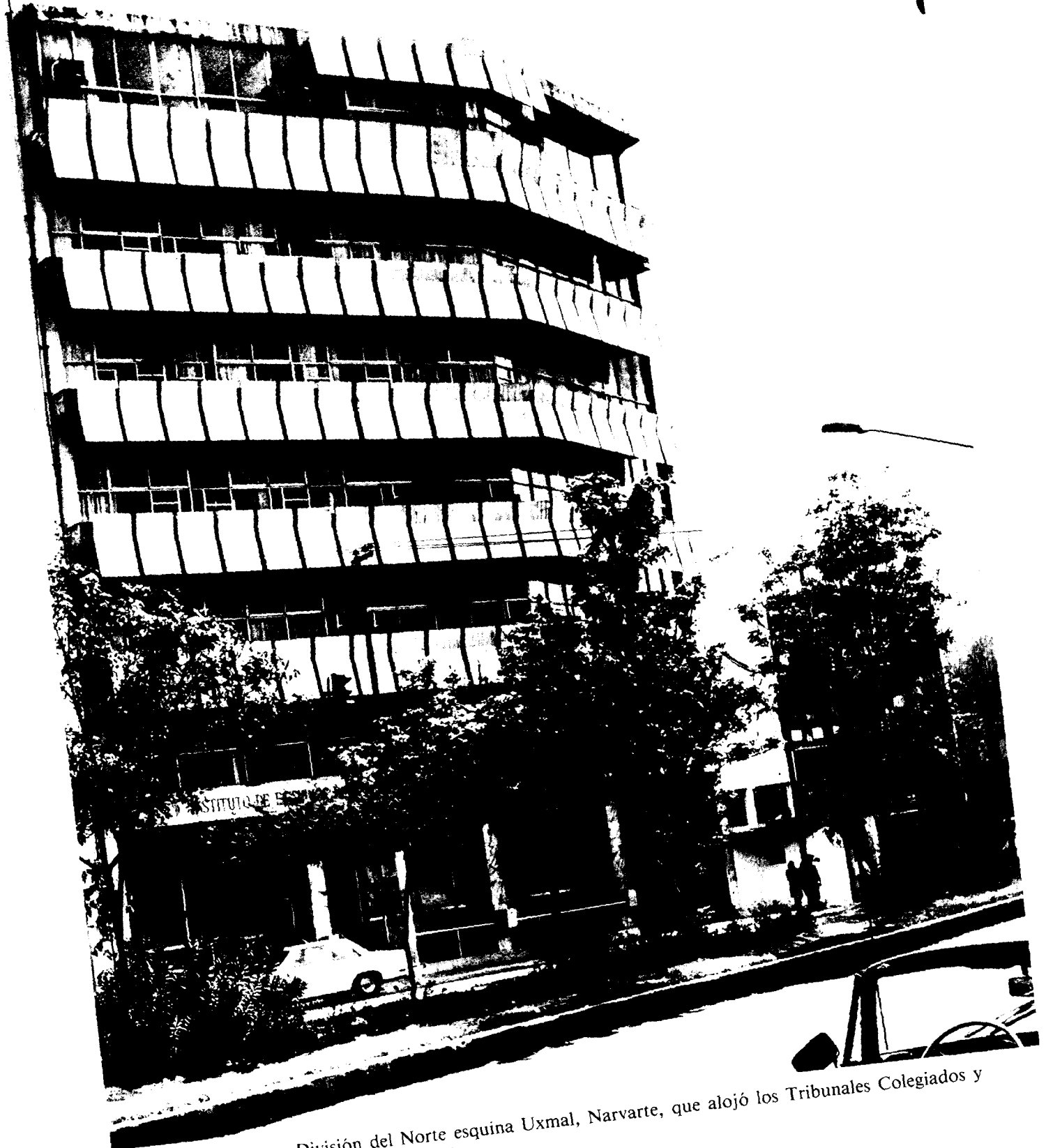
130 Inmueble de Av. División del Norte esquina Uxmal, Narvarte, que alojó los Tribunales Colegiados y Unitarios del Primer Circuito, 1968-1975.