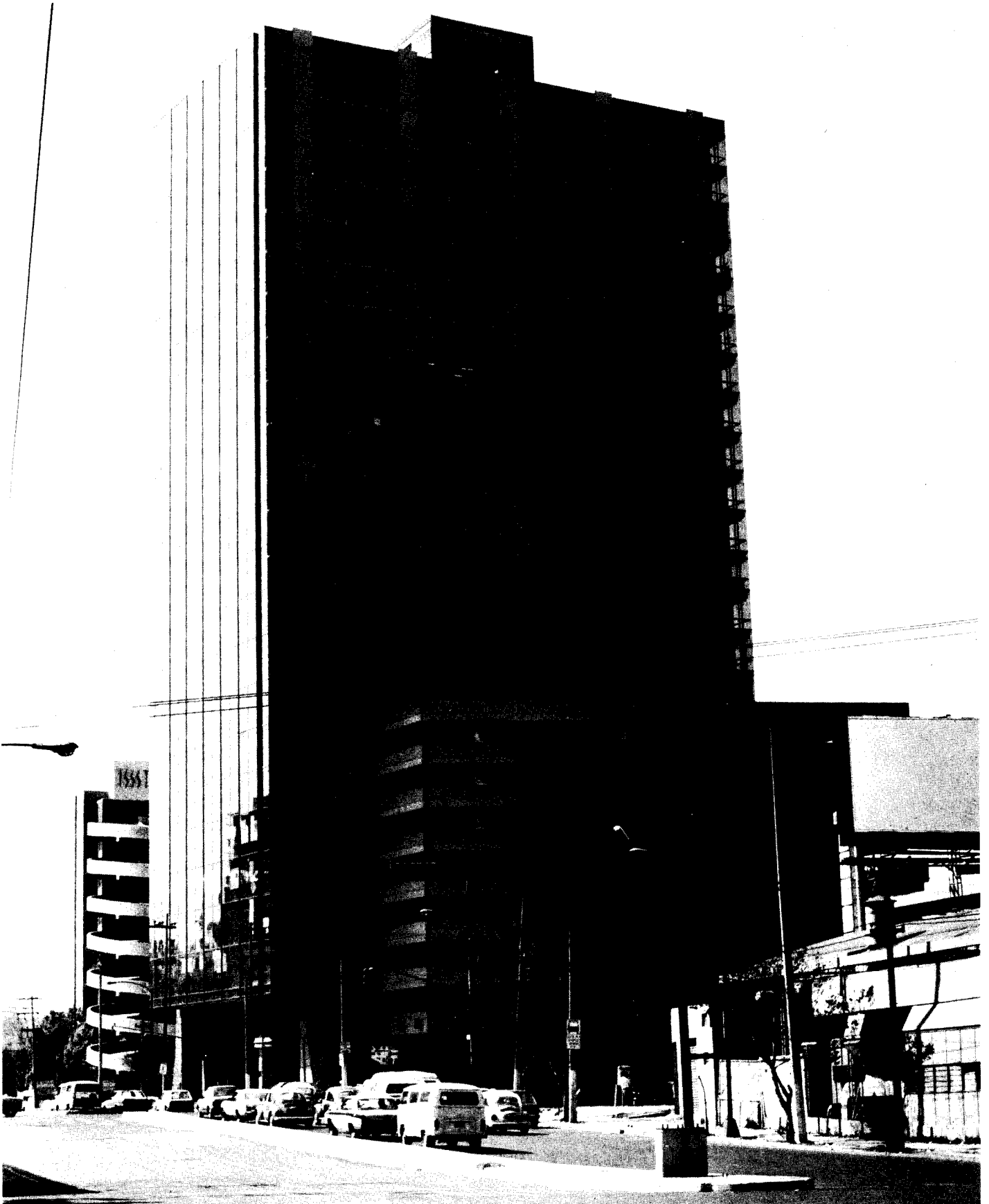
133 Edificio sito en la Av. Universidad 1311, esq. con Río Churubusco Zona Sur de la Ciudad, Sede actual de los Tribunales Federales del Primer Circuito. Vista Norte-Sur.