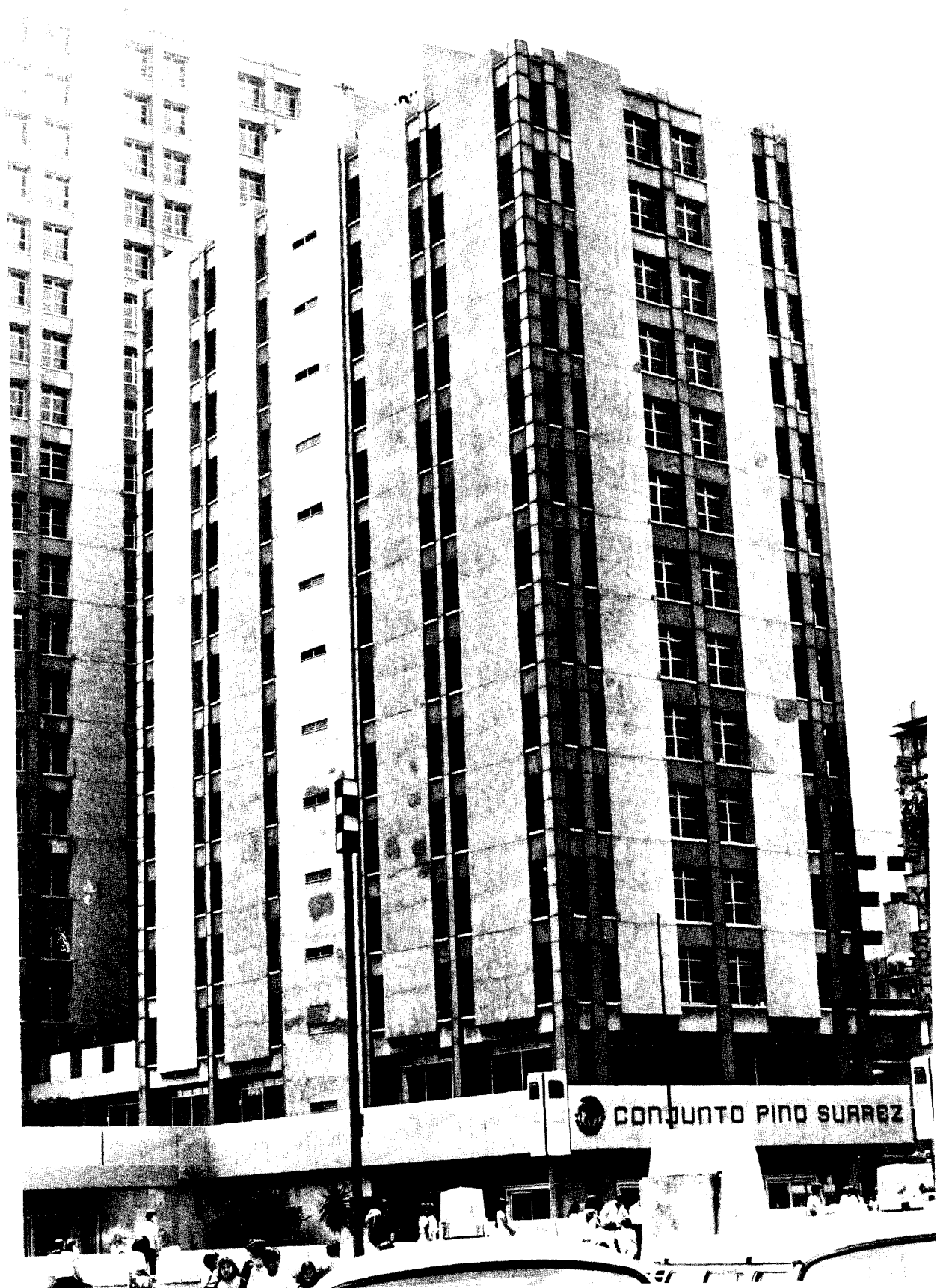
131 Vista de la Torre A del Conjunto Pino Suárez, que ostentaba la puerta principal de ingreso a dicho Conjunto.