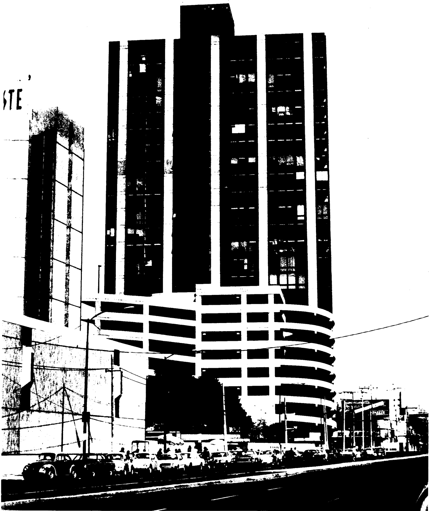
134 Edificio en la Av. Universidad esq. Río Churubusco, vista Sur-Norte, con el anexo del estacionamiento para automóviles.