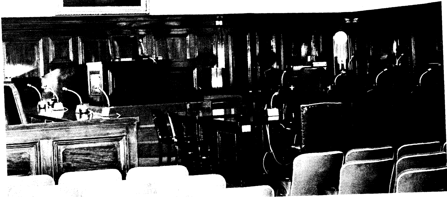
135 Suprema Corte de Justicia de la Nación. Salón del Tribunal Pleno. Sitiales de los Señores Ministros y Presidium.