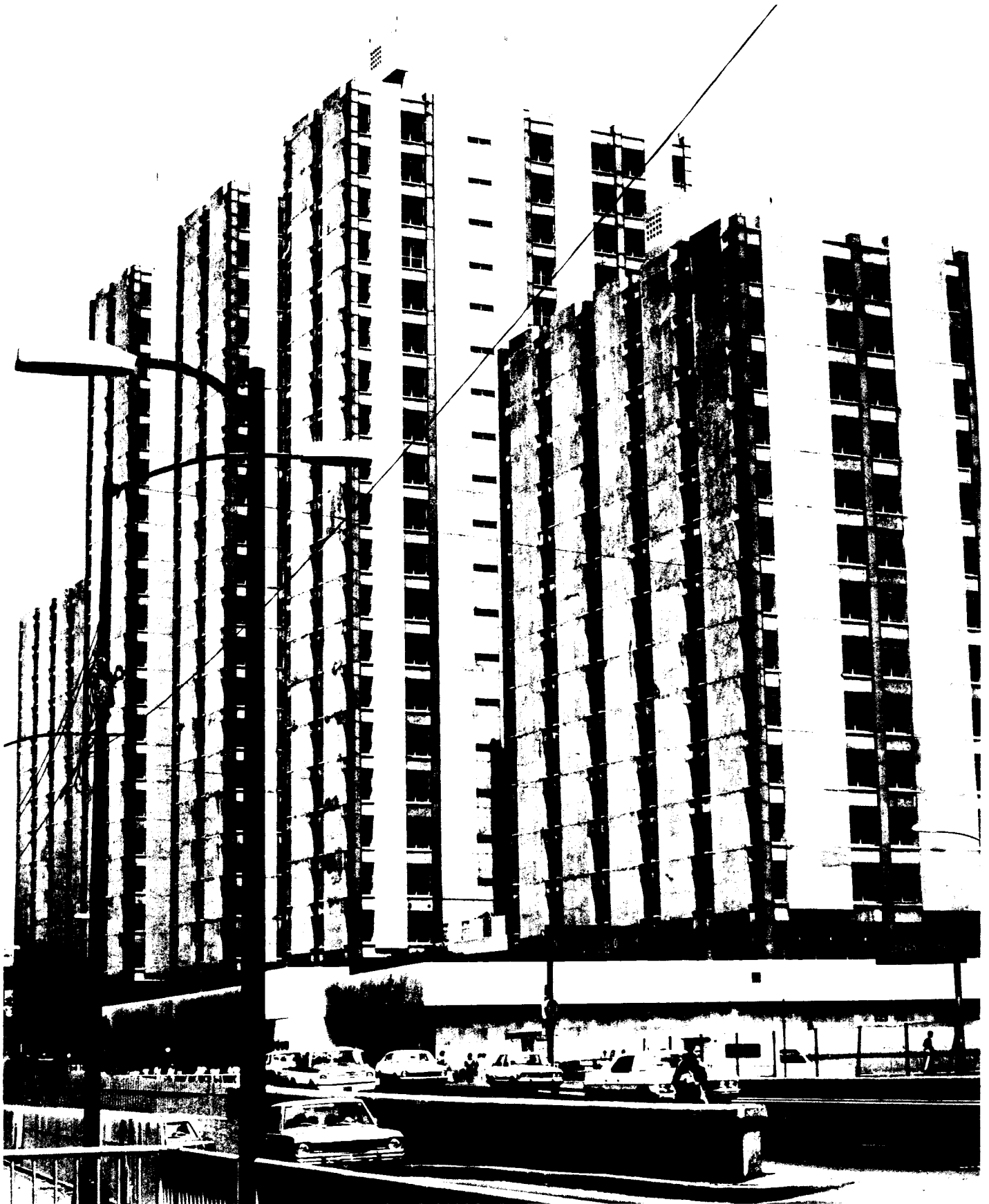
132 Perspectiva del Conjunto. Los Tribunales Federales y Juzgados de Distrito ocupaban las Torres C y D.