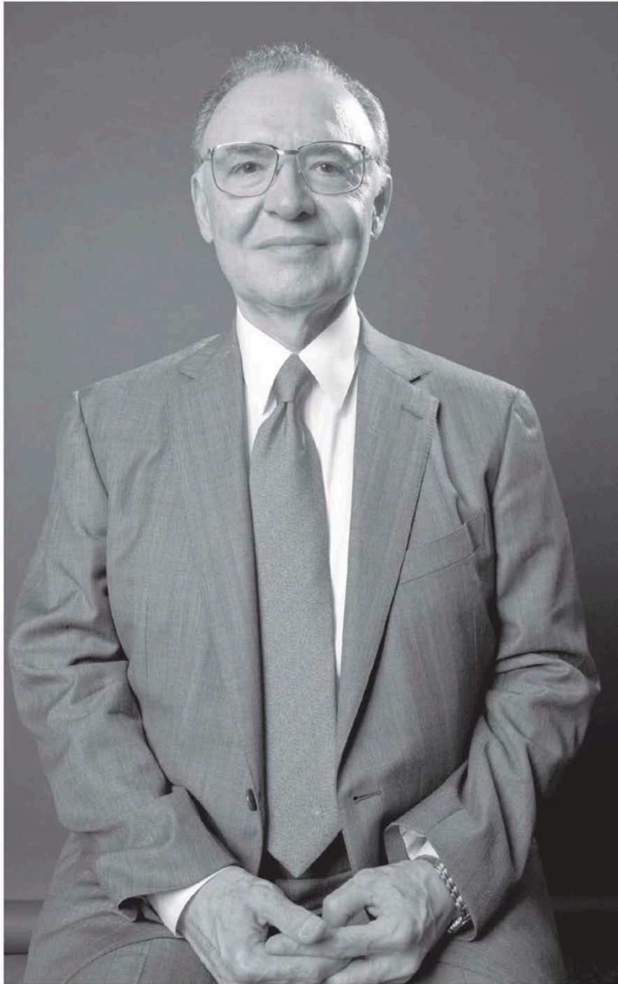
Investigador emérito en el Instituto de Investigaciones Jurídicas y en el Sistema Nacional de Investigadores