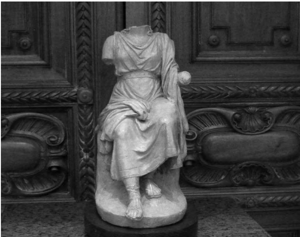
Alegoría de la Constitución de 1824. Museo Nacional de Arte

En el ámbito económico sus acciones fueron más lentas, aunque de las primeras que vale la pena destacar fue su oposición a los corporativismos que la corona y las administraciones de la Nueva España establecieron en favor de los españoles. Las más importantes aparecerían nueve años después con los Proyectos de deuda Pública presentados en noviembre de 1833 por don Lorenzo Zavala y otro por José María Luis Mora, iniciativas de ley 16 que aunque siguieron la estrategia que los propios reyes católicos españoles pusieron en práctica desde fines del siglo XVIII, a partir de la reorganización administrativa impuesta por la Casa de los Borbones, 17 en el caso mexicano fracasaron y sólo prosperarían hasta las leyes Lerdo y Juárez, así como en las de Reforma creadas por los integrantes de la segunda generación de liberales.