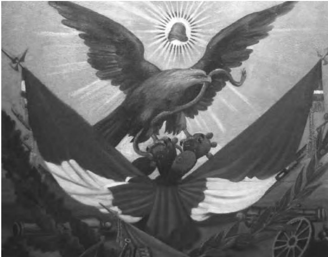
Águila republicana. Siglo XIX.

objeto de “contener un tanto los desórdenes que por muchas partes pululaban, so color de que la nación estaba sin constitución, y no había brújula que la condujese a puerto de salvamento.