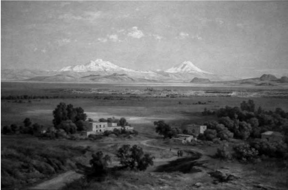
El valle de México desde la Villa de Guadalupe. Pintura de José María Velasco, siglo XIX.