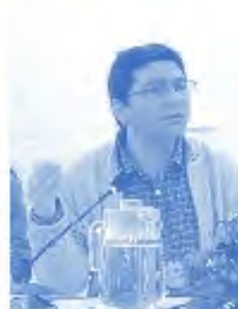
Pablo Badenier Martínez Ministro de Medio Ambiente de Chile

Un grupo de 30 participantes de los talleres en Uruguay viajó a continuación a Santiago de Chile, donde tuvo lugar un taller con jóvenes de la Juventud Demócrata Cristiana chilena. Este taller contó con la presencia, de Pablo Badenier Martínez (ministro de Medio Ambiente), Ignacio Walker Prieto