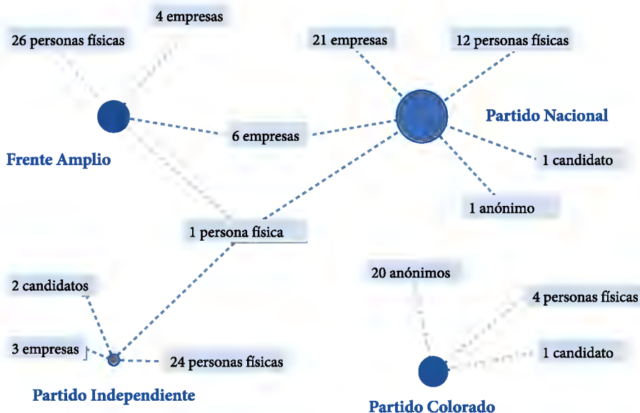
Figura 1. Red de donaciones a las fórmulas presidenciales (elección de 2009)