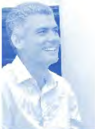
RODRIGO GOÑI Diputado del Partido Nacional.

Es una lección maravillosa de la historia contemporánea. Un llamado de atención, un llamado a despertar nuestra conciencia para poder captar y advertir y alertarnos del peligro que representan todos los muros que día a día se levantan. Hoy a nivel internacional y al nivel de nuestras comunidades nacionales se siguen levantando muros, por motivos políticos pero también motivos religiosos, motivos culturales. Y creo que la mejor forma de celebrar, de recordar ese hecho es haciendo un llamado, primero —siempre arrancando por casa, por uno mismo—, a despertar esa conciencia, que a veces se duerme un poco y no advierte que hay que reaccionar rápida y vehementemente contra todos esos muros que nos siguen dividiendo a los ciudadanos de un país pero también del mundo.