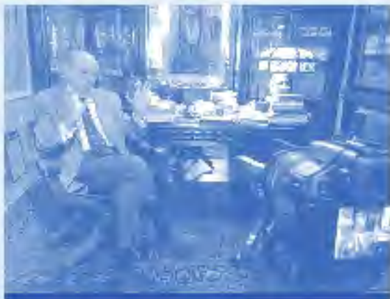
JULIO MARÍA SANGUINETTI Expresidente de la República Oriental del Uruguay (1985-1990 y 1995-2000).

La caída del muro de Berlín marca un hito simbólico en el desarrollo histórico global. Así como la caída de la Bastilla doscientos años antes simbólicamente representó el fin del absolutismo monárquico y el comienzo de la etapa republicana democrática, exactamente doscientos años después la caída del muro representó el fin del enfrentamiento que había tenido la democracia con la concepción comunista. Esos fueron los dos siglos más políticos de la historia. A partir de 1989, la concepción democrática liberal enfrentó sucesivamente muchos aniversarios ideológicos: enfrentó al fascismo, al falangismo, al nazismo, al comunismo y, finalmente, siempre terminó imponiéndose la concepción de la libertad.