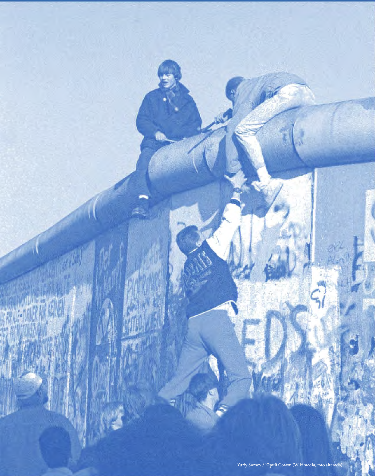
Yuriy Somov / Юрий Сомов (Wikimedia, foto alterada)