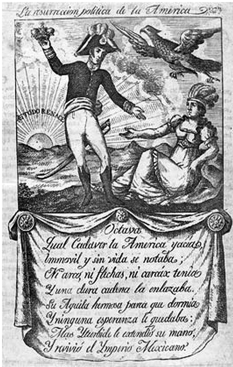
Ilustración anónima hecha en apoyo a la lucha por la independencia.