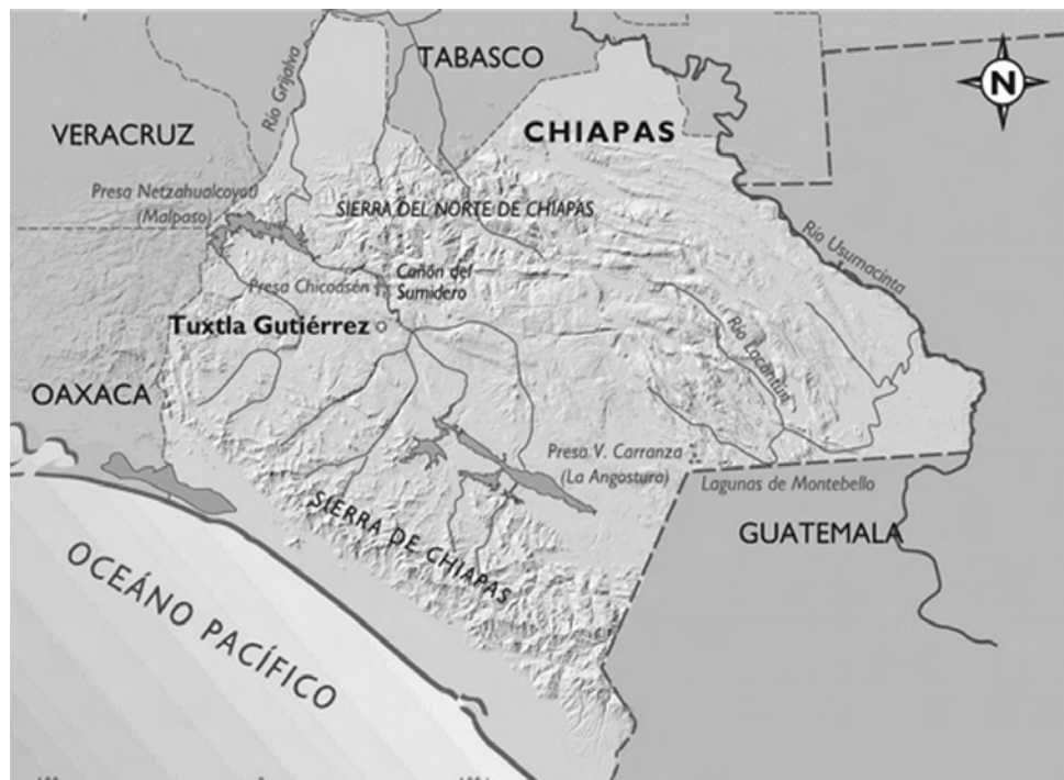
Mapa físico de Chiapas

En 1790 Chiapas, formando aun parte de la Capitanía General de Guatemala fue elevada al rango de Intendencia, con mayor cobertura administrativa y política.