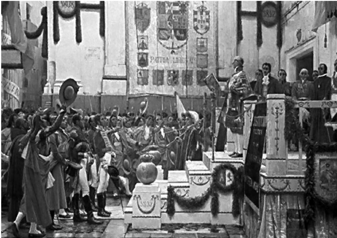
Cortes de Cádiz

presión política de las propias Cortes, se terminó por decretar su observancia el 12 de septiembre de 1812, a pesar de lo cual, la Ley de Libertad de imprenta realmente no se aplicó.