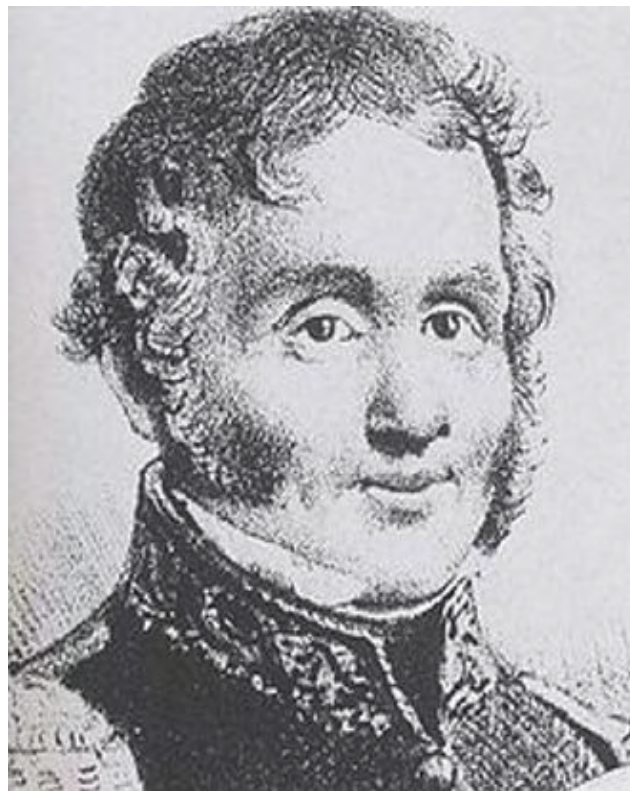
Gral. Vicente Filisola

Debe aclararse que la votación entre los diputados de ese Congreso fue nominal y quedó empatada, por lo que algunos sugerían que se esperara la llegada de los representantes de Ixtacomitán y de Tapachula que aún faltaban para conocer su voto; no obstante, los separatistas se impusieron y se decidió oficializar la decisión, mediante el Decreto expedido el 31 de julio de 1823, ya con la presencia de los representantes de las dos localidades mencionadas y en donde se deja claro que la Junta se elevaba a la categoría de Suprema Junta Provincial, en la que en adelante residirían los poderes Ejecutivo, Legislativo y Judicial, quedando entonces Chiapas como provincia libre e independiente de México o de Guatemala, con la posibilidad de reincorporación a alguna de las dos naciones si así lo decidieron los ayuntamientos de la región en su oportunidad.