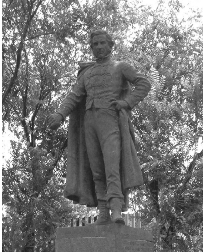
Dr. Joaquín Miguel Gutiérrez, escultura situada en el Paseo de la Reforma, ciudad de México.

independientes de la Capitanía General de Guatemala y, con fecha 22 de octubre de 1821 solicitaban su unión con el Imperio Mexicano 5 .