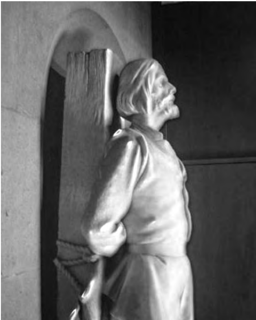
Detalle de la escultura de Guillén de Lampart

Como el tribunal eclesiástico no podía imponer pena de muerte, la Inquisición relajaba al reo; la relajación equivalía a la pena de muerte y el inquisidor lo sabía cuando la dictaba. Las autoridades seculares tenían que aceptar el veredicto y llevar a cabo el castigo, es decir ejecutar al reo.