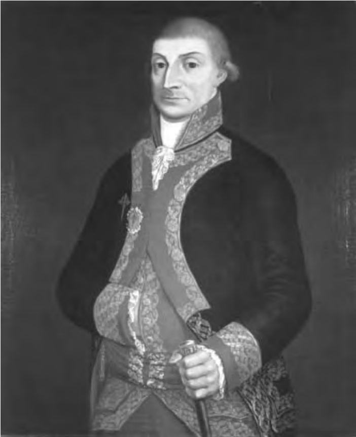
Virrey de José de Iturrigaray

A pesar de la oposición, el oidor Jacobo de Villaurrutia coincidió parcialmente con ellos, Primo de Verdad y Azcárate propusieron que ante la ausencia del monarca, la soberanía de la colonia debería quedar en manos del pueblo, el cual estaría representado por los diversos ayuntamientos, así como con los diputados de cabildos seculares y eclesiásticos, de esta forma la soberanía estaría delegada en un congreso, Villaurrutia propuso un congreso menos numeroso, representado por corporaciones civiles, eclesiásticas y militares, todos ellos ceñidos en la oportunidad que brinda el estado de vacatio regis al que el Imperio Español nunca se había enfrentado, ante esta situación el pueblo tomó la iniciativa de organizarse mediante juntas provinciales.