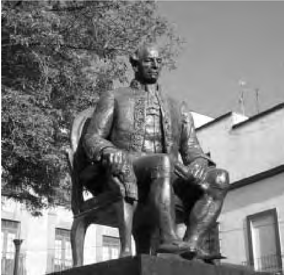
Escultura de Primo de Verdad, situada en la ciudad de México.

cercanías del palacio, cosa anormal para su época, al entrar en el palacio, y a continuación en su dormitorio, la pareja creyó haber concluido su jornada. Sin embargo, las fuerzas comandadas por Gabriel de Yermo y los Patriotas de Fernando VII , tenían partidarios en el seno de la guardia, que les permitieron la entrada al palacio sin ninguna resistencia.