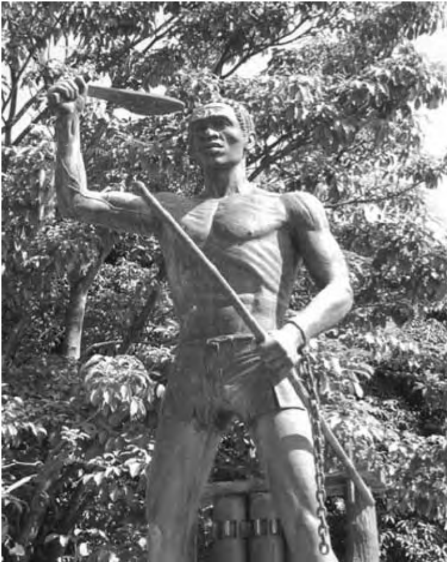
Otro ángulo de la escultura de Gaspar Yanga Escudo del municipio de Yanga

Los españoles rechazaron los términos, y se desató una batalla con grandes pérdidas para ambos bandos. Los españoles avanzaron en el asentamiento de Yanga y lo incendiaron. Sin embargo, la gente huyó a los alrededores que por ser terreno difícil, impidió a los españoles alcanzar una victoria definitiva; ante esto, los españoles acordaron entrar en negociaciones. Eventualmente los términos de Yanga