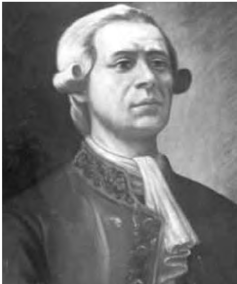
Retrato del Lic. Francisco Primo de Verdad.

Puestos como prisioneros de las fuerzas francesas de ocupación, Bonaparte reunió a los reyes con Godoy el 30 de Abril de 1808, dos días más tarde, el pueblo de Madrid conoció la noticia y luchó contra el ejército invasor, hecho conocido como