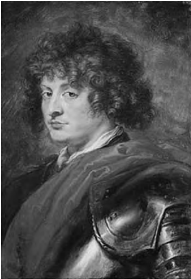
Detalle de supuesto retrato de Guillén de Lamport o Lampart o Lombardo.