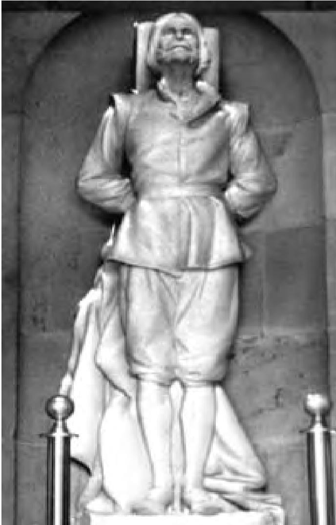
Escultura de Guillén de Lampart ubicada en el interior de la columna de la Independencia.

Los inquisidores también hicieron imprimir y fijar en todas la iglesias donde mandaban que, dentro de las 6 horas siguientes, bajo pena de dos mil ducados o de cuatrocientos azotes, entregaran el libelo que había escrito el irlandés en contra de ellos.