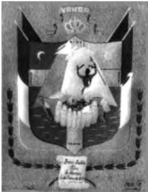
Escudo del municipio de Yanga

fueron convenidos, con la cláusula adicional que solamente los sacerdotes franciscanos atenderían a la gente, y concedieron a la familia de Yanga el derecho a gobernar en esa nueva área. 11