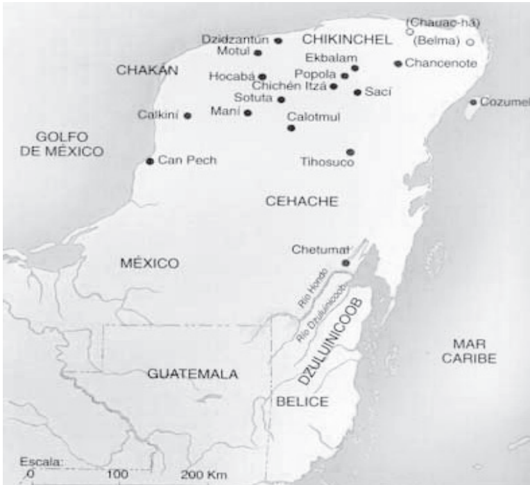
Mapa 2. Capitales prehispánicas en la península de Yucatán hacia 1525 36