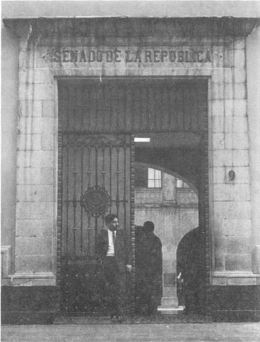
Fachada principal de la Cámara de Senadores

El Colegio Electoral de la Cámara de Diputados se integrará por cien presuntos diputados propietarios nombrados por los partidos políticos en la proporción que les corresponda respecto del total de las constancias otorgadas en la elección de que se trate.