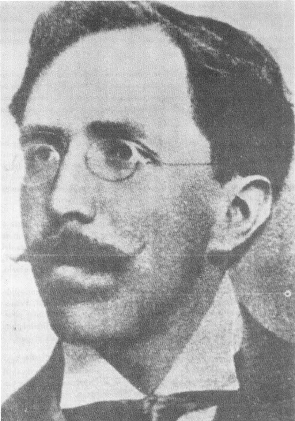
Luis Cabrera, autor de la Ley Agraria carrancista de 1915