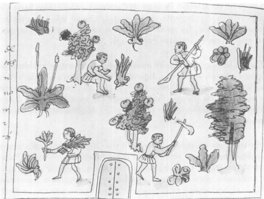
Los monarcas distribuían, mediante títulos llamados de gracia o merced, las tierras realengas o del dominio de la Corona.