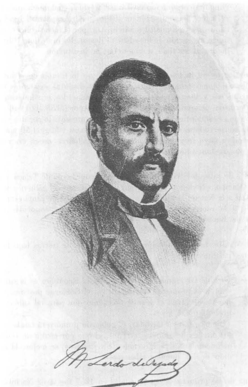
Miguel Lerdo de Tejada, autor de la Ley de Dasamortización de 1856 y coautor del Manifiesto juarista de 1859