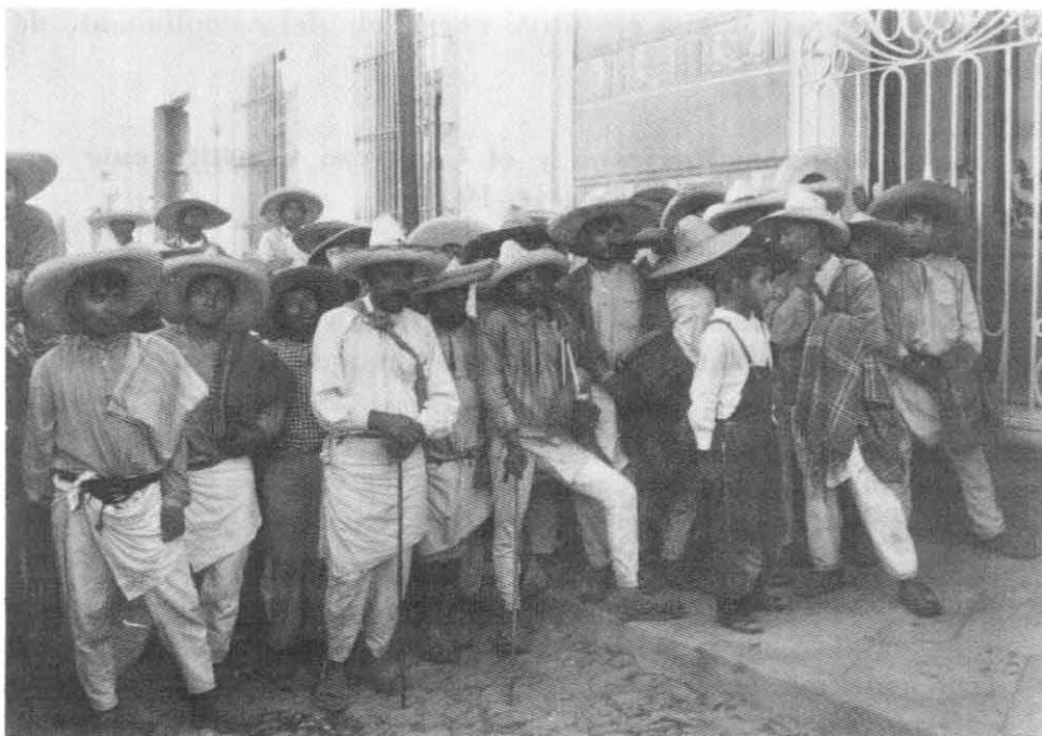
Campeños esperando respuesta a sus demandas agrarias

I. Madero, en el Plan de San Luis, emitido el 5 de octubre de 1910, además de declarar nulas las elecciones y de desconocer al gobierno de Porfirio Díaz, expuso en el artículo 3o. de este Plan que: