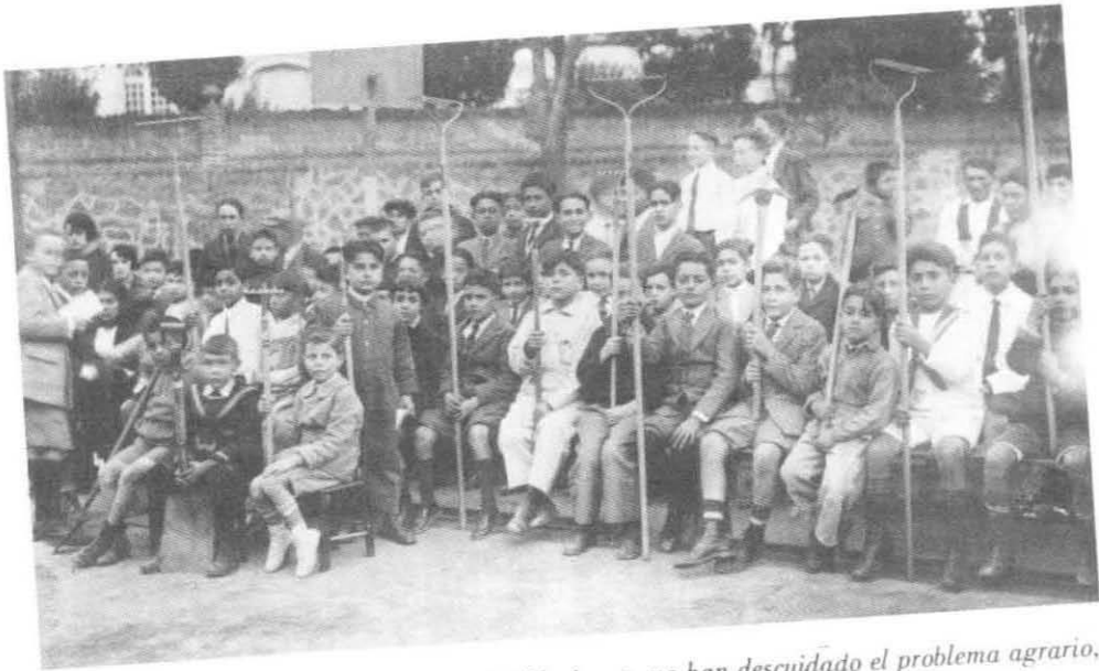
Los gobiernos posteriores a la Revolución Mexicana, no han descuidado el problema agrario, por lo que han realizado constantes esfuerzos por solucionarlo