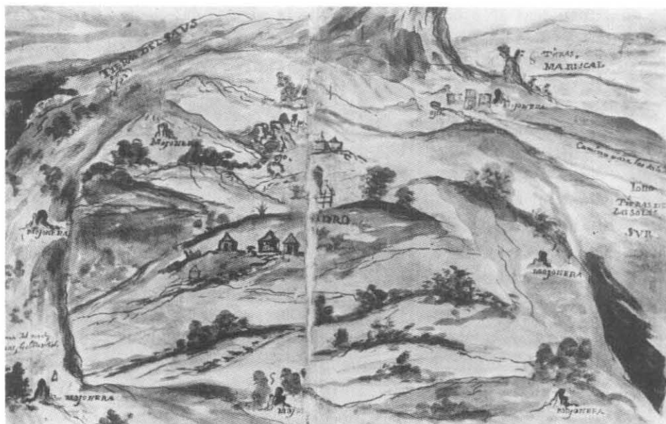
Hacienda de San Isidro, León, Gto. 1738