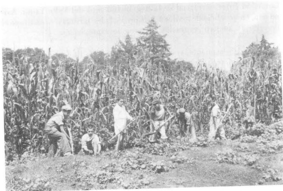
Durante el gobierno de Lázaro Cárdenas, el reparto ejidal se incrementó notablemente