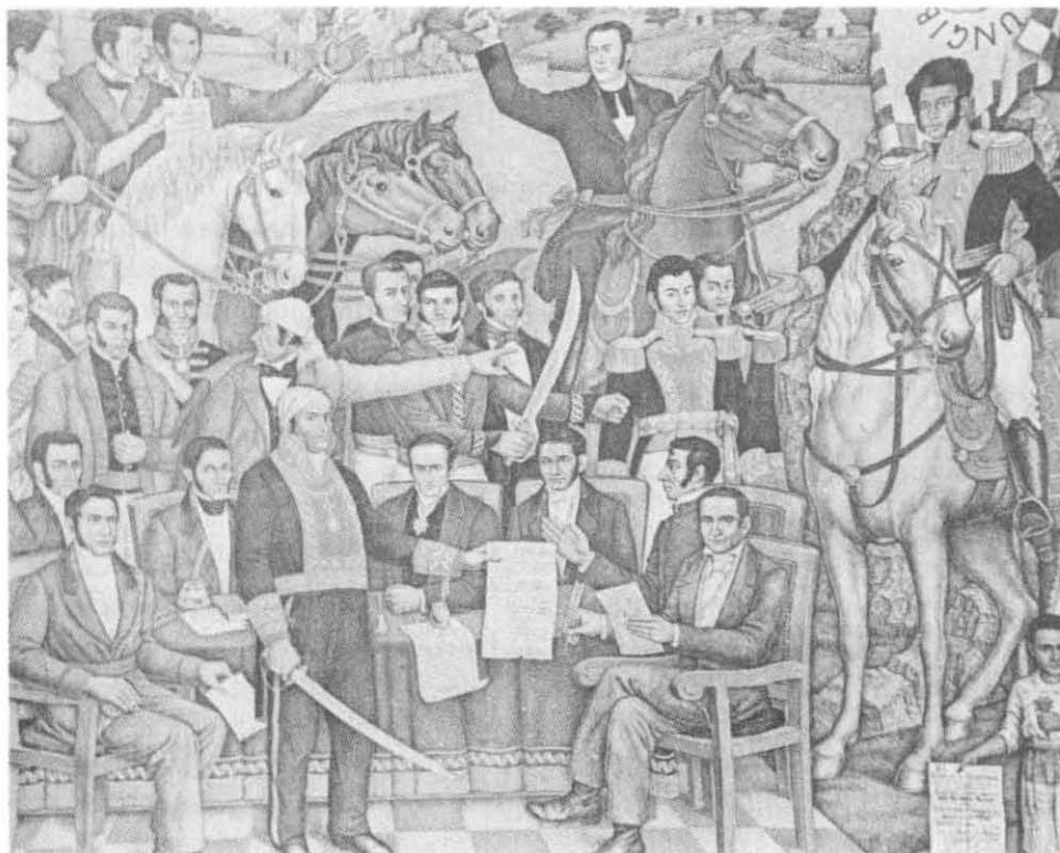
Los caudillos de la Independencia siempre se preocuparon por una justa repartición de tierras