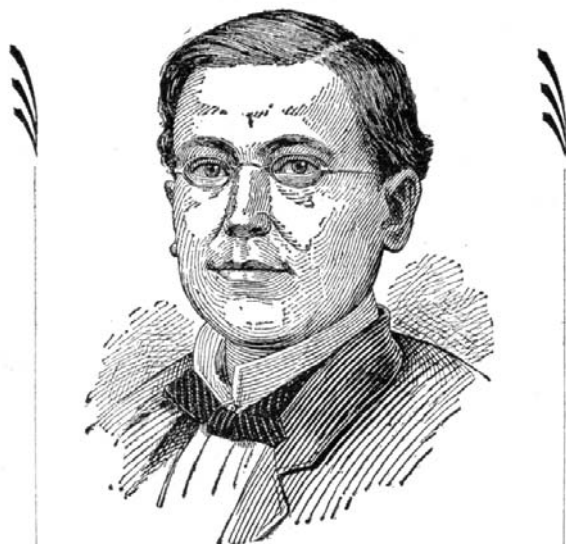
Gral. Ignacio Zaragoza

Este folleto fué impreso por acuerdo expreso del Sr. Gral.