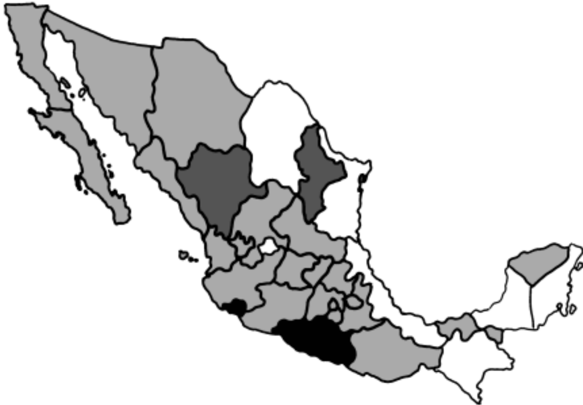
MAPA 1. POSICIÓN ELECTORAL DEL PARTIDO DEL TRABAJO RESULTANTE DE LA ELECCIONES FEDERALES DE 1994