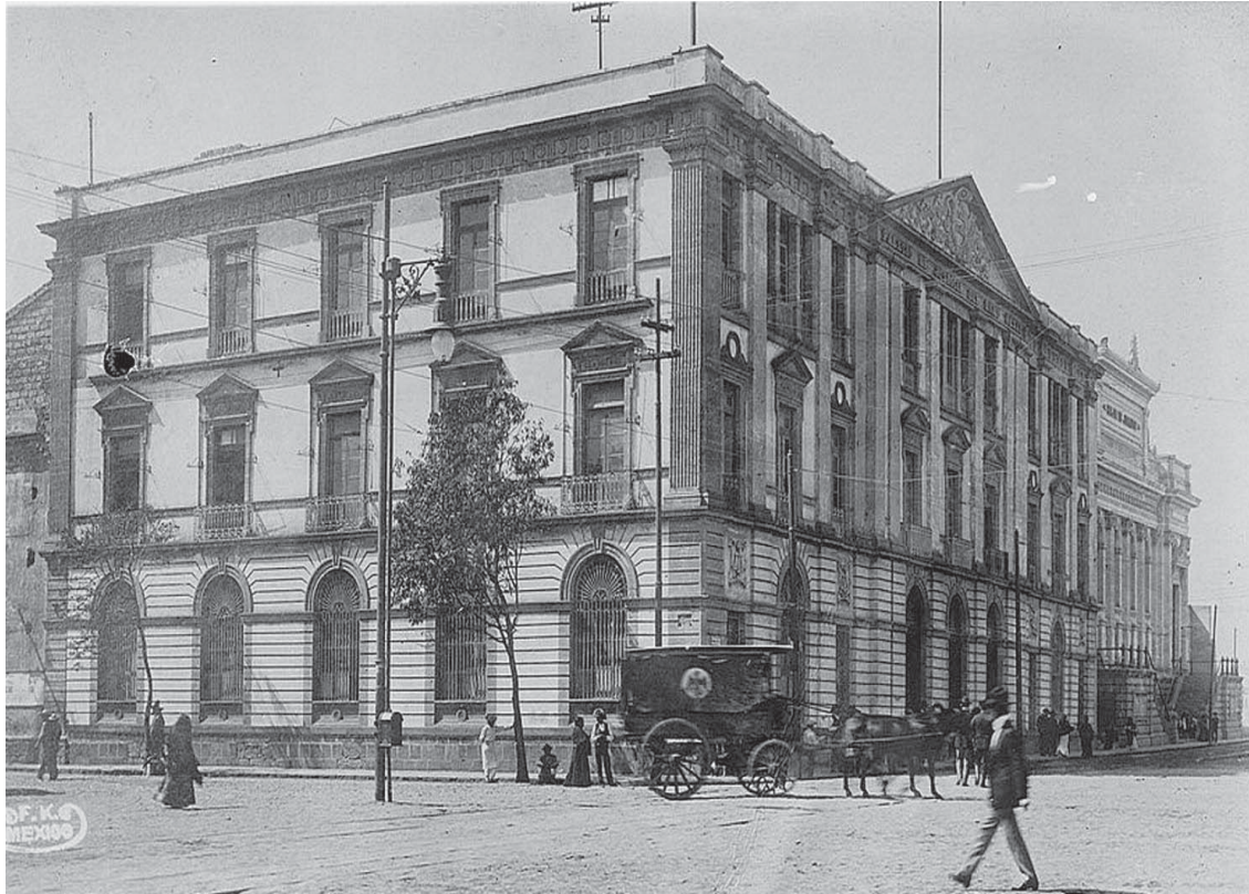
Cárcel de Belem.

Desde 1814 se intentó modificar el sistema carcelario, impulsando reparaciones físicas en algunos de los muy deteriorados establecimientos carcelarios novohispanos y se crearon y modificaron reglamentos, intentando generar una normatividad mas moderna para la ejecución penal, proceso que duró unos años menos del siglo, culminando en lo físico con la fundación de Lecumberri en 1900 y con la aprobación de los códigos penales y reglamentos penitenciarios que poco a poco fueron regulando el procedimiento penal y la aplicación de las penas.