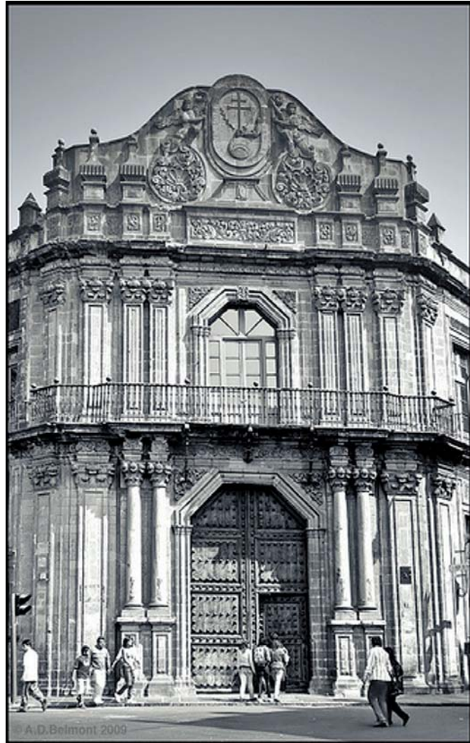
Fachada de la “Casa Chata”, antigua cárcel de la inquisición, actualmente “Palacio de la Escuela de Medicina”.

La publicación de un pequeño opúsculo sobre Los delitos y las Penas, del Marqués de Beccaria, impulsa hacia una decisión racional y se efectúa la sustitución, algunas veces sin suprimirla totalmente, de la pena de muerte, presentando la cárcel como una opción diferente que pronto va a demostrar su útil inutilidad en muchos aspectos.