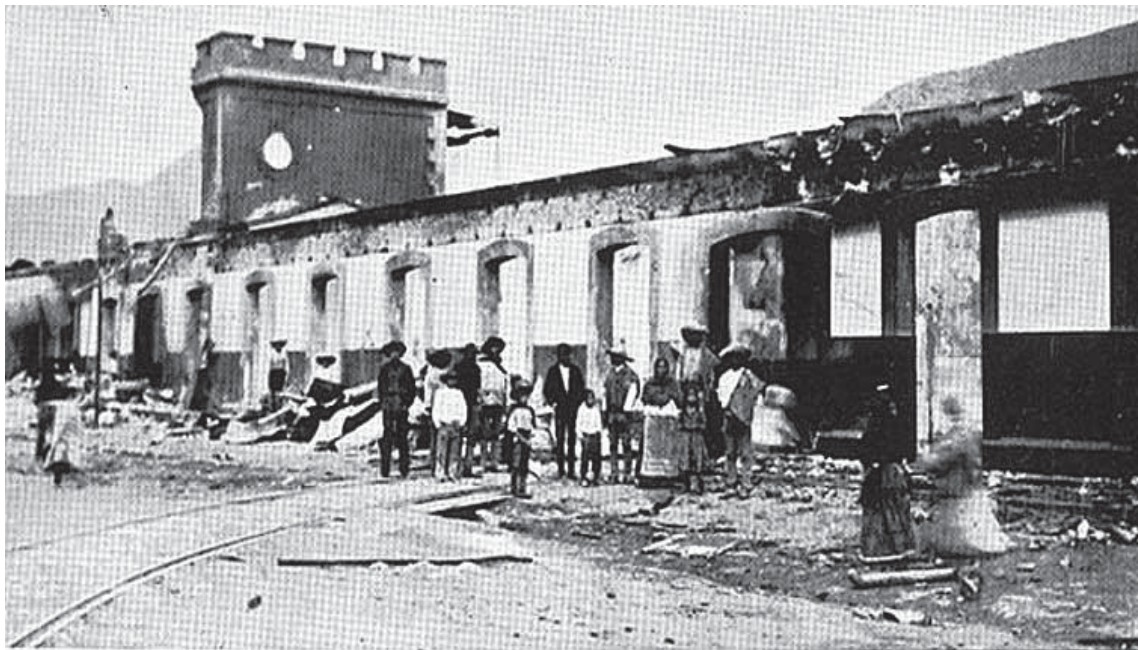
Huelga de Río Blanco. Las casas de los obreros después de su incendio. 1907

Independientemente de lo anterior, nuestra consideración, sostenida en otros foros, es que la correlación de fuerzas resulta del todo desventajosa a los trabajadores, pues lo que podríamos denominar el movimiento obrero, se encuentra desarticulado y los distintos movimientos que se han dado a conocer, pretenden con mucho, ser los llamados emergentes