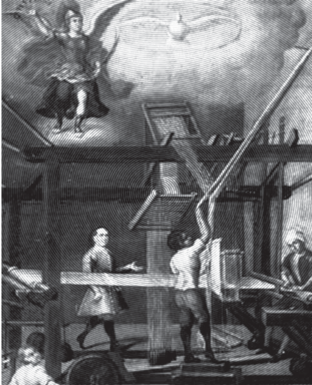
Obraje en la Nueva España.

cualidad normativa de un derecho que en la actualidad resulta de dudosa procedencia, a partir del 23 de septiembre pasado, especialmente por las limitaciones 2 que los legisladores crean para obstaculizar el ejercicio del Derecho, como el caso de Mexicana de Aviación en 1983. 3