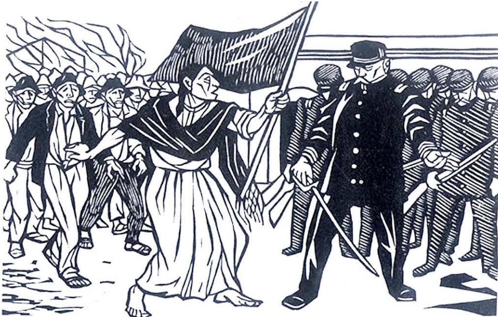
Fernando Castro Pacheco: huelga de Río Blanco.

irrenunciable” 22 también consideran que los conflictos colectivos, refiriéndose al paro, modificación, suspensión y/o terminación de las relaciones de trabajo, normalmente son acciones que ejercitan los patrones, y son los que “crean, suspenden o terminan condiciones de trabajo e igualmente pueden ser individuales o colectivos.” 23