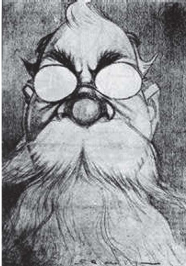
Caricatura de Venustiano Carranza, publicada en Multicolor, 1913.

constituyentes de 1916-1917 plantearon una crítica y una oposición total al conjunto de la sociedad y exigieron sin duda alguna un cambio total de las condiciones morales de la vida... que prevalecían bajo el régimen porfirista, es decir, una verdadera revolución” 10 .