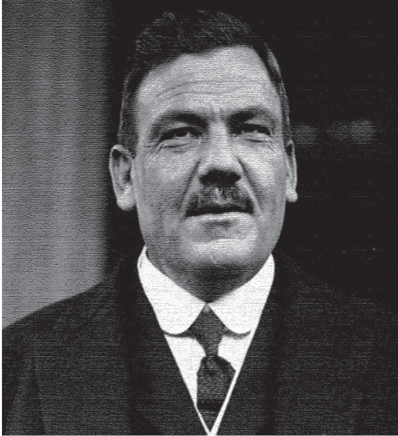
Presidente Plutarco Elías Calles, durante su gestión se promulgó el Código Civil.

de un nuevo Código Civil, que recogiera y plasmara el ideario social de la Revolución. Surgió así el Código Civil de 1928, expedido por el presidente Plutarco Elías Calles el 30 de agosto de 1928, en uso de la facultad que le concedió el H. Congreso de la Unión, por decretos de 7 de enero y 6 de diciembre de 1926.