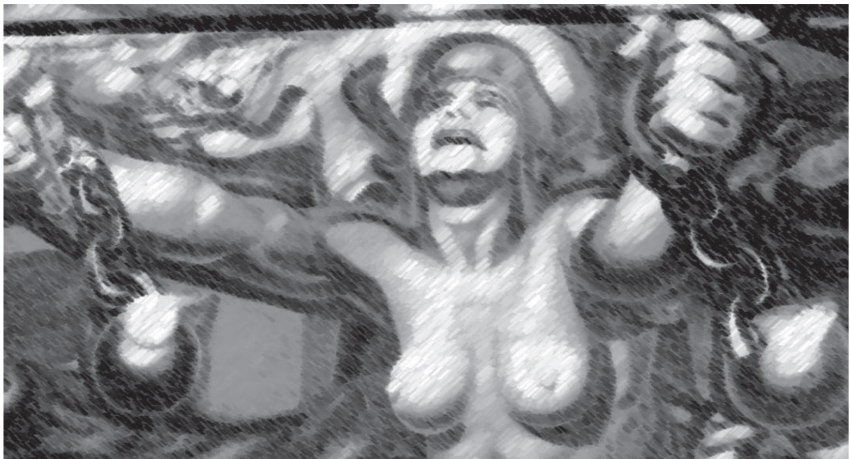
“Nueva democracia”, detalle del mural de David Alfaro Siqueiros, interpretado en tiza y carbocillo.

La influencia del espíritu social que anima al Código, es más o menos notorio en diferentes temas. El importantísimo relativo a la materia de nulidades, se enfoca de una manera más técnica y completa que en el Código Civil de 1884, siendo notable la clasificación de las mismas en absolutas y relativas, atendiendo principalmente, a si afectan o no el interés general, o si bien sólo al interés particular; en el primer caso, el acto afectado de nulidad (que es absoluta) no es susceptible de convalidación; en el segundo (nulidad relativa), sí lo es (artículos 2226 y 2227): “Tratándose de la nulidad de las obligaciones, se estableció una doctrina más clara y fundada. Como principio básico, se sostiene que sólo la ley puede establecer nulidades, y éstas se dividen en absolutas y relativas, resultando las primeras de los actos ejecutados contra el tenor de las leyes prohibitivas o de interés público. A la segunda categoría pertenecen todas las demás. Las nulidades absolutas pueden ser declaradas de oficio por el juez, debe alegarlas el Ministerio Público, y no son susceptibles de ser confirmadas por la voluntad de las partes o invalidadas por la prescripción. Las nulidades relativas sólo pueden alegarlas las personas a cuyo favor han sido establecidas y pueden desaparecer por la confirmación” (Exposición de Motivos).