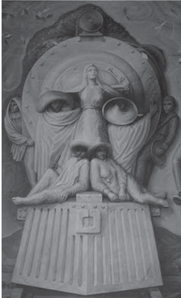
Representación de Venustiano Carranza según el pintor Octavio Ocampo.

“ebrios habituales”, pues su condición puede acarrear secuelas indeseables para su cónyuge o su descendencia.