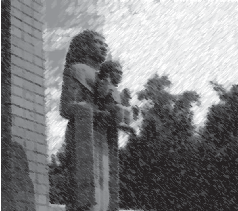
Detalle del monumento a la madre, México D.F., interpretación en tiza y carboncillo.