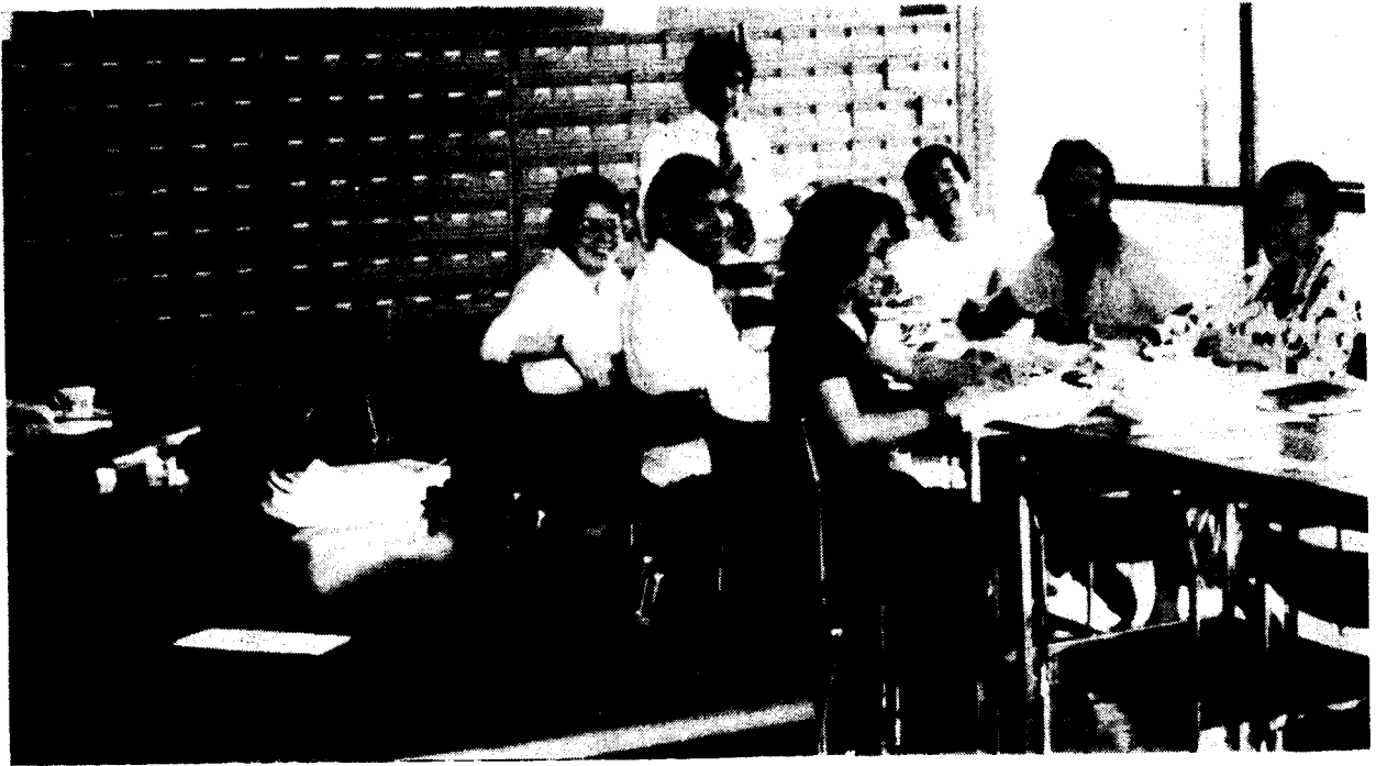
Una sesión de trabajo del equipo de Avance bibliográfico jurídico.