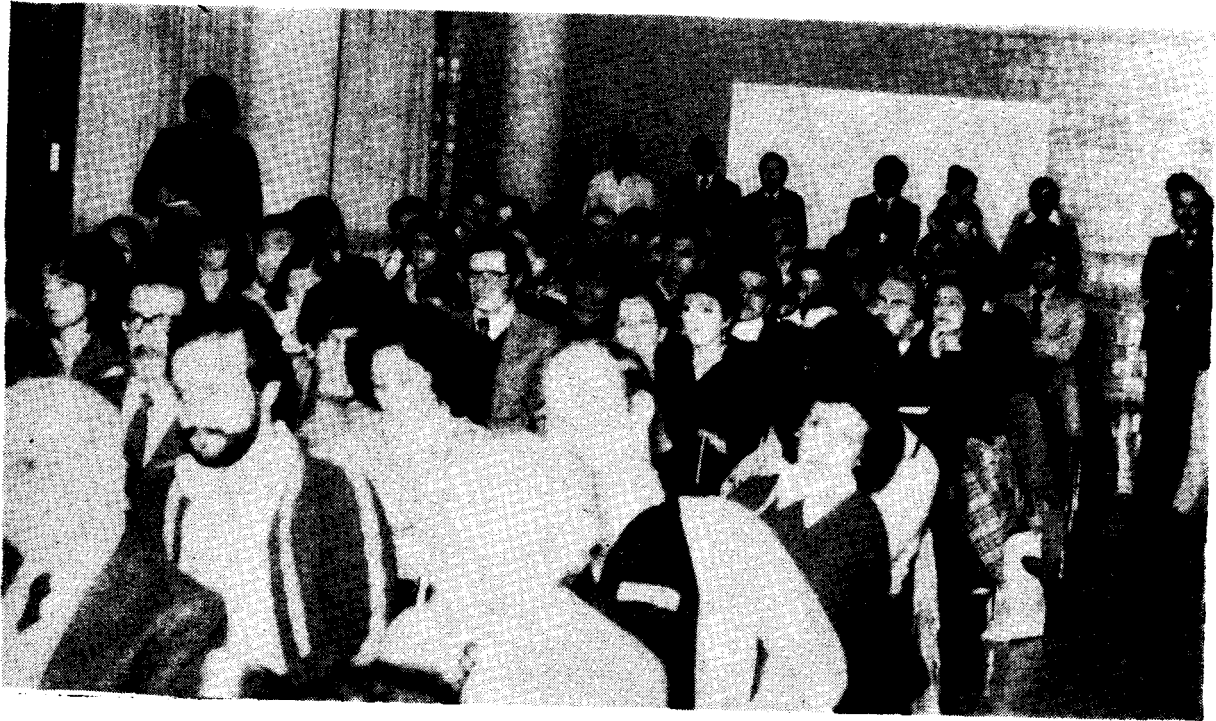
El Auditorio durante una conferencia.