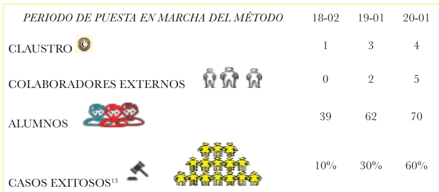
TABLA HISTÓRICA DE LA CONSOLIDACIÓN DEL MÉTODO “LA CLÍNICA JURÍDICA”

Finalmente, la diversidad de la población de alumnos que se atiende permite que los casos y los clientes, incentiven a los operadores jurídicos en formación al aprendizaje por medio del Método Clínico Jurídico y en su espacio natural que es el Foro, ponen de manifiesto su responsabilidad social con una comunidad a la que se le ha negado el acceso democrático a la Justicia.