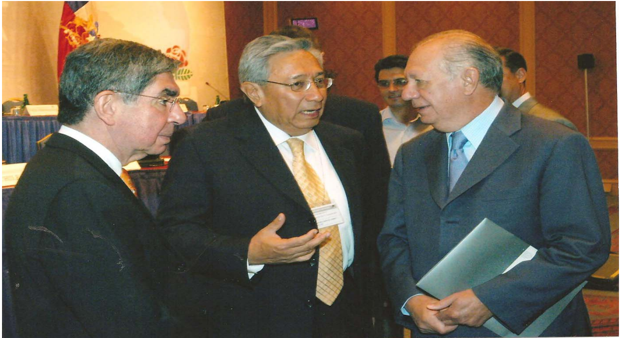
Conversando con el Presidente Ricardo Lagos y el Presidente Oscar Arias, acerca del conflicto postelectoral en México. Santiago de Chile, Octubre de 2006.