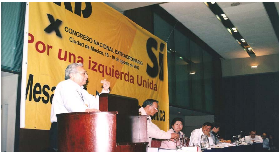
Interviniendo en las sesiones del X Congreso Nacional del PRD.