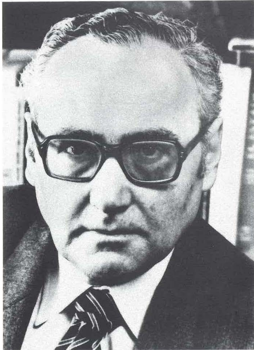
Doctor Héctor Fix-Zamudio