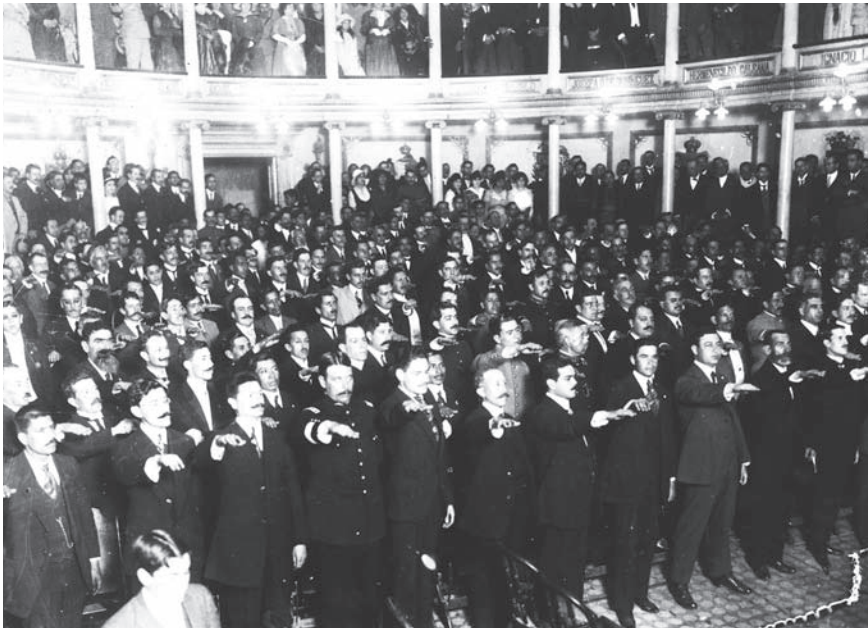
Los diputados protestan cumplir la nueva Constitución.