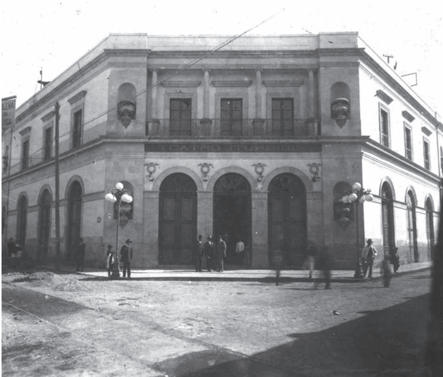
Teatro Iturbide, donde se celebraron el resto de las sesiones.