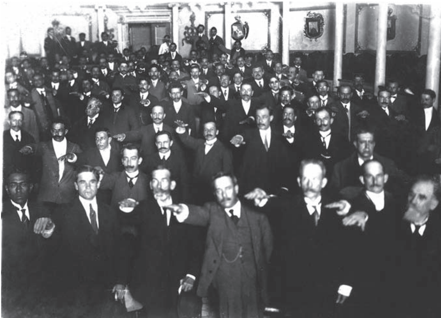
Los diputados rindiendo protesta.