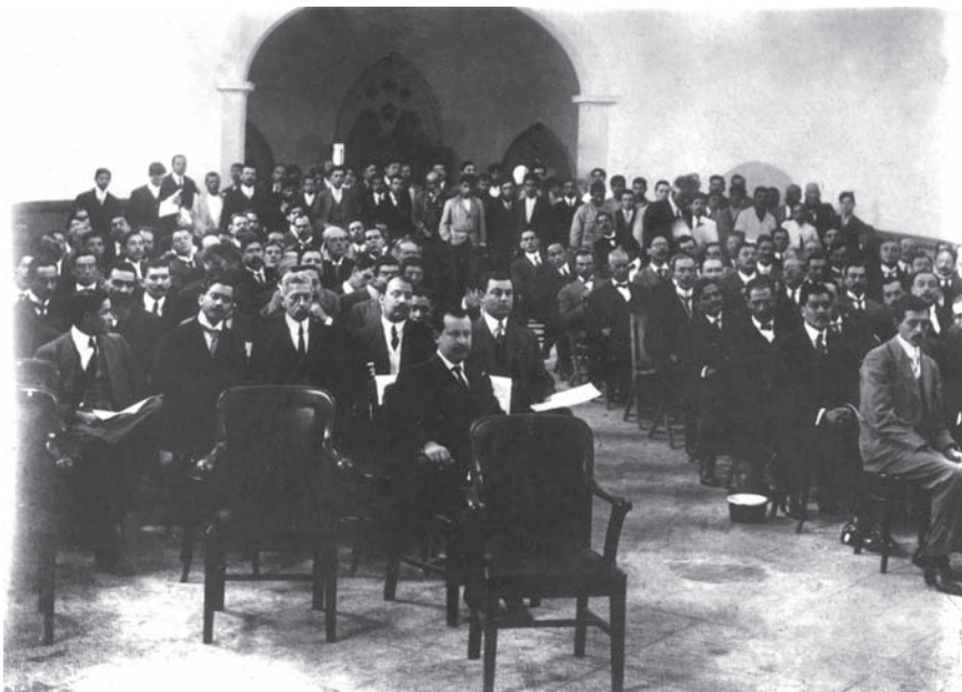
Aspecto del salón durante la primera sesión.

Con la llegada de 1916, los principales grupos opositores del constitucionalismo —villistas y zapatistas— estaban deshechos, no obstante, seguía habiendo levantamientos a lo largo y ancho del país. Obregón y González fueron los encargados de apagar esos levantamientos.