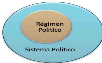
Figura No. 2 Sistema y régimen políticos