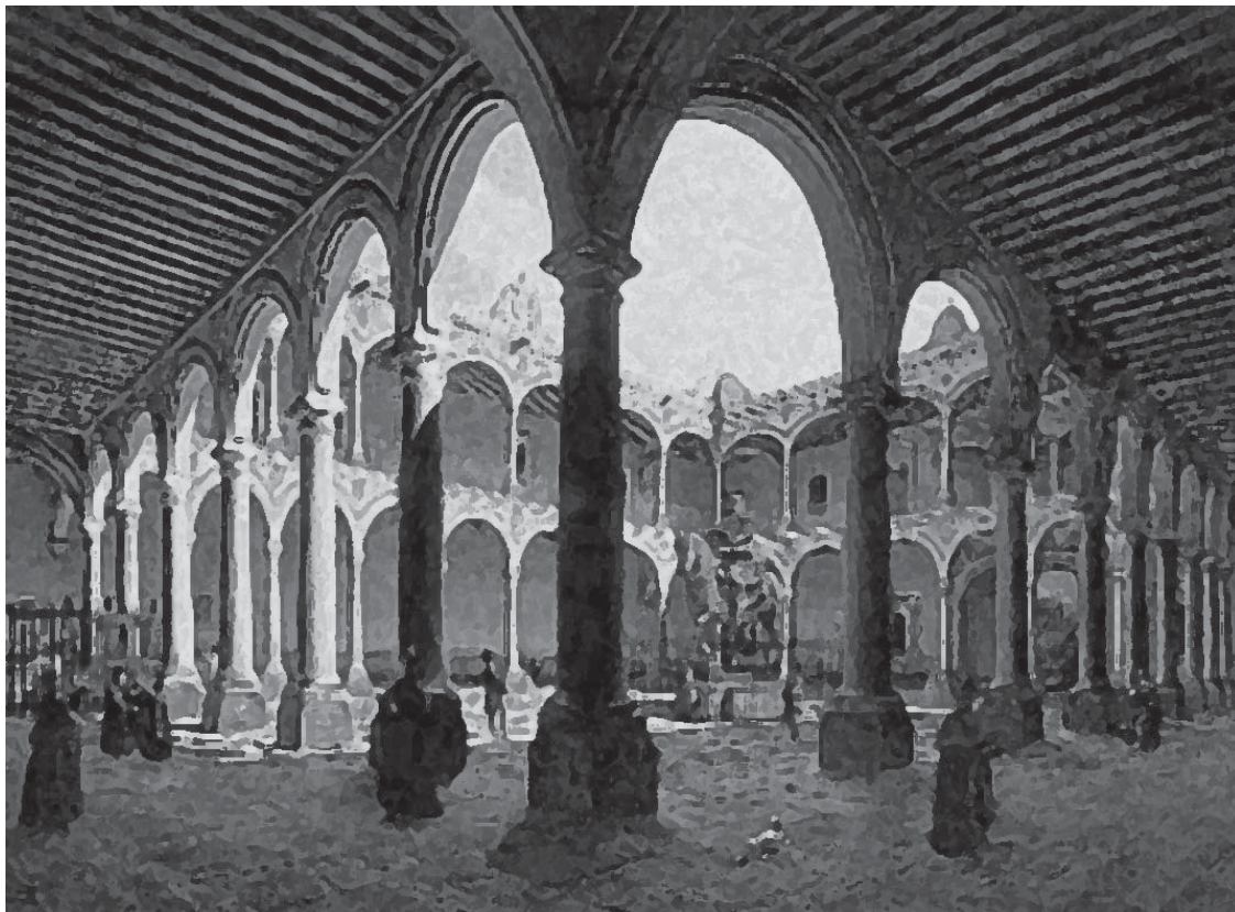
Interior de la Universidad/ Pedro Waldi / siglo XIX / óleo sobre tela / 57x41.2cm.

Si bien es cierto que la Universidad se le reconoció personalidad en el año de 1553, mismo año que en distintos puntos de la Ciudad de México iniciaran los cursos, pasarían años para que la Universidad encontrara un lugar propio “frente a la antigua Plaza de El Volador y fue el 29 de junio de 1584, cuando el arzobispo y visitador de la Universidad Pedro Moya de Contreras puso la primera piedra. Aún sin haberse terminado el edificio —por falta de fondos— se iniciaron las clases en noviembre de 1592. Y el edificio quedó terminado totalmente en 1631” 6 .