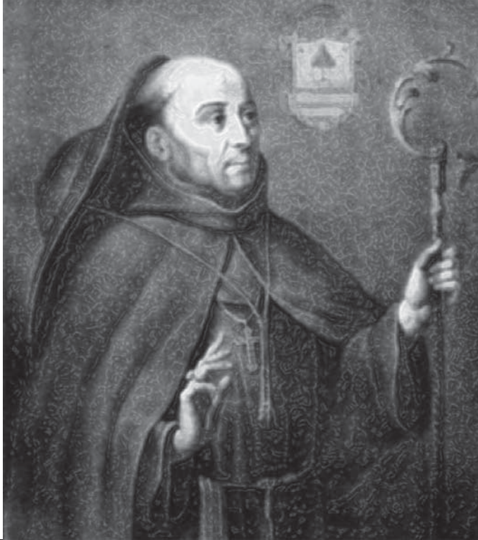
Fray Juan de Zumárraga.

Un hombre que con actitud fuerte y proactiva mantuvo una constante fricción con las autoridades religiosas, así como gubernamentales de su tiempo, situación que nunca desestimó en su ímpetu de escribir peticiones al Rey Don Carlos a quien conociera en el convento del Abrojo donde se desempeñaba como guardia e iniciara ahí mismo su profesión religiosa.