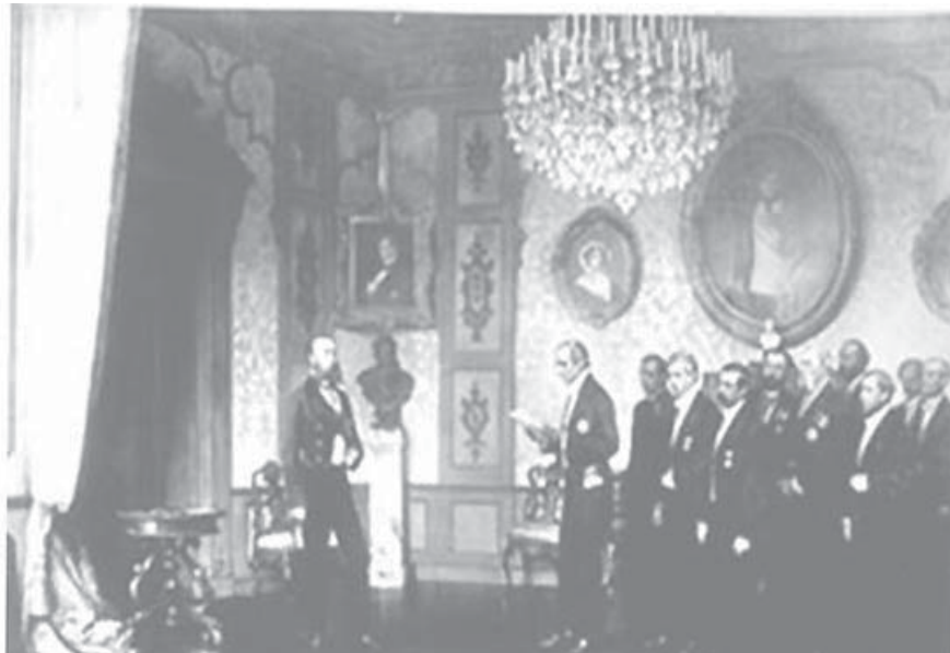
Retrato del Archiduque Maximiliano y de los miembros de la diputación mejicana que ofrecieron la Corona del imperio a salir el 3 de octubre de 1863 en Mira mar Plata-gelatina

Existe una frase que no puede estar más llena de verdad, la cual explica que la historia la escriben aquellos que se han sobrepuesto y resultan victoriosos en el campo de batalla, en este sentido escribir la historia depende cien por ciento de los factores reales del poder y en específico del oro que se le paga para escribir una versión oficial.