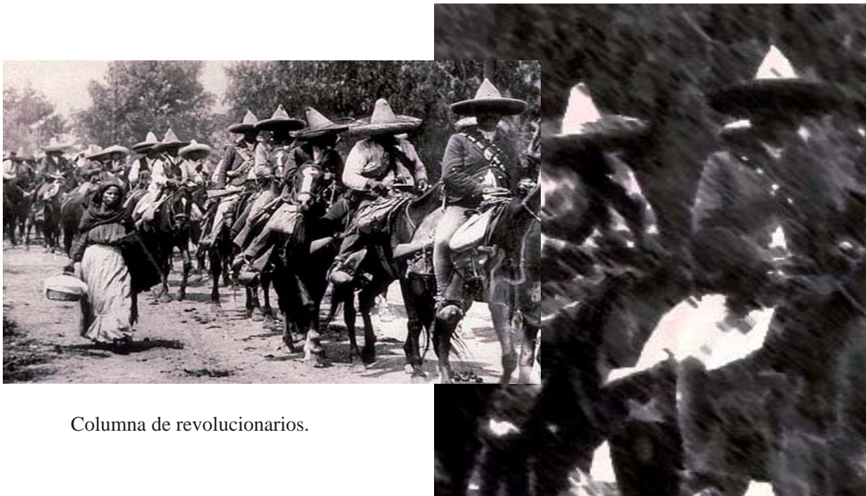
Columna de revolucionarios.

10 BOBBIO, Norberto, MATTEUCCI, Niccola Y PASQUINO, Gianfranco, Diccionario de Política , Tomo II, Siglo XXI Editores, 16ª edición, México, 2008, p 1412.