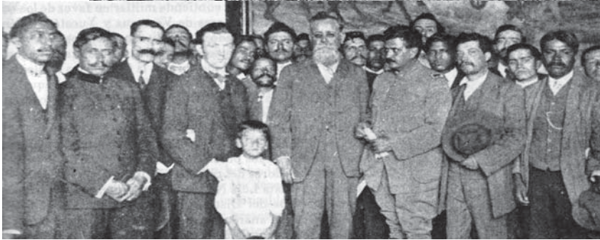
Arriba: Fábrica de Río Blanco. Abajo: Carranza con representantes de la Casa del Obrero Mundial.