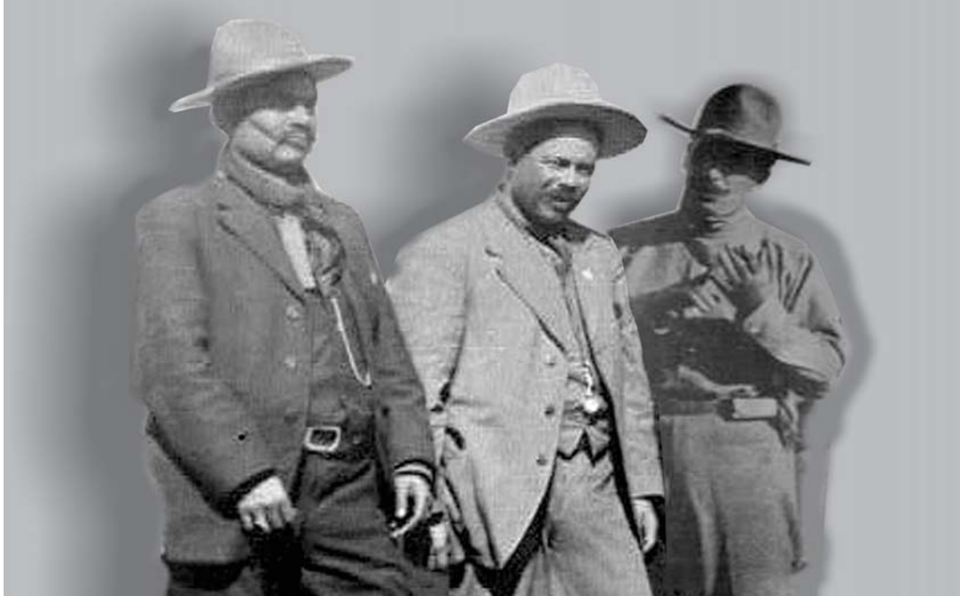
Francisco Villa con dos de sus colaboradores más cercanos y que son sus extremos: Rodolfo Fierro y Felipe Ángeles.