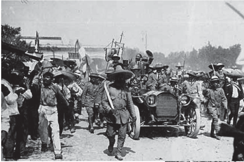
Francisco I Madero en Cuernavaca.