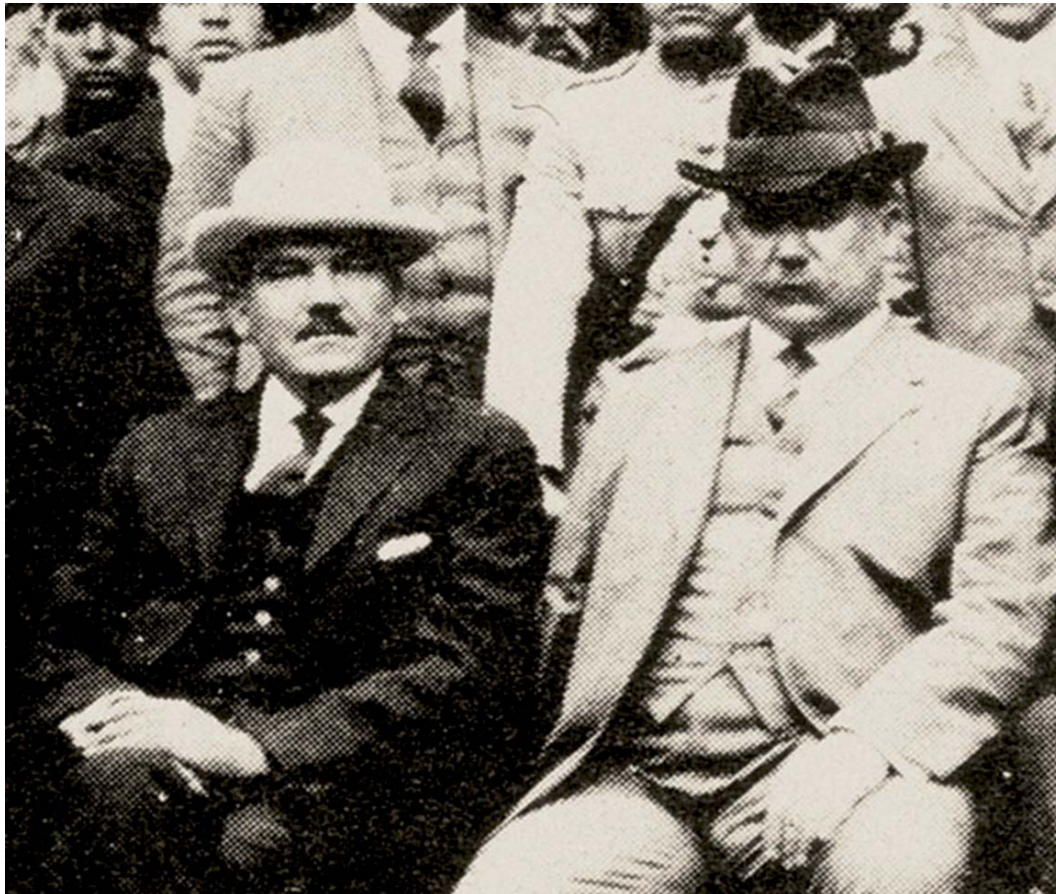
Plutarco Elías Calles y Álvaro Obregón.

aspectos socializantes, la función social de la propiedad, la igualdad entre hombre y mujer, el reconocimiento de los hijos naturales, dentro de la legislación, dar algunos efectos al concubinato; así como el movimiento social de la vida moderna -de 1928-, la pauta de tratar igual a los desiguales, seguramente invadía intereses de grupo, que necesariamente oponían una resistencia.