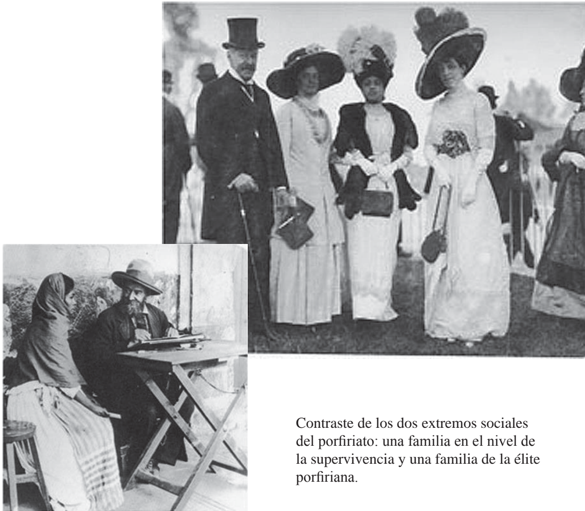
Contraste de los dos extremos sociales del porfiriato: una familia en el nivel de la supervivencia y una familia de la élite porfiriana.

a menudo de carácter local (había fracasado un intento del 17 de septiembre de 1913, de ampliar el concepto de comerciante, incorporando en él a todos los agricultores, con el fin de hacer posible una ley federal para el trabajo agrícola)... A partir de 1914, varias leyes locales impusieron nuevas normas laborales, estipulando salarios mínimos, cancelando deudas de obreros (como en Tabasco), y fijando jornadas máximas. Son de especial interés las leyes respectivas de Jalisco (Aguirre Berlanga); de Veracruz (Cándido Aguilar, 4 y 9 de octubre de 1914), y de Yucatán, donde Salvador Alvarado promulgó un grupo de leyes sociales “las cinco hermanas”; una ley agraria, una fiscal, una catastral, una que organiza el municipio libre, y una de trabajo, creando esta última, las Juntas de Conciliación y un Tribunal de Arbitraje para conflictos laborales, individuales y colectivos...” 29 Estas materias, tradicionalmente formaban parte del Derecho civil, pero como es lógico inferir; hoy, en el 2010, han tomado otros rumbos, se han emancipado, y esto, infiere en la descodificación , ya citada y sostenida en este trabajo.