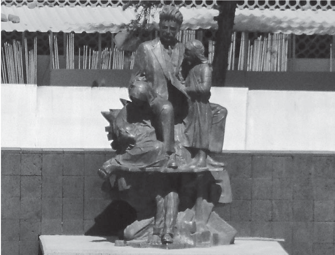
Escultura de Ignacio García Téllez.