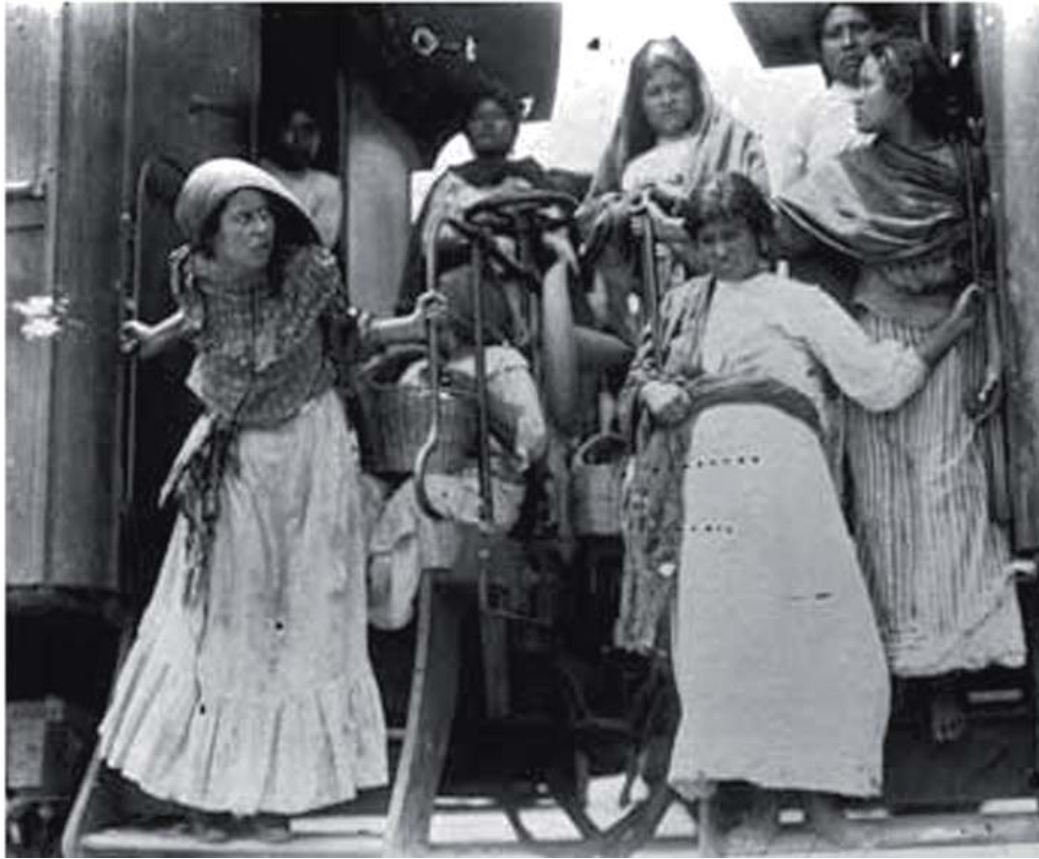
Grupo de soldaderas bajando de un tren.

de Jefe del ejército constitucionalista. Se dio en el contexto del Plan de Guadalupe y los compromisos sociales que Carranza, pretendía hacer efectivos para los mexicanos y sus familias.