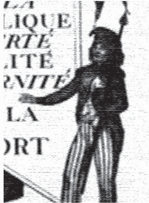
Alegoría de la República francesa.

acompañada del uso de la violencia, de derribar a las autoridades políticas existentes y de sustituirlas, con el fin de efectuar profundos cambios en las relaciones políticas, en el ordenamiento jurídico constitucional y en la esfera socioeconómica... Agrega Bobbio, “los diversos tipos de movimientos colectivos que apuntan a introducir cambios de naturaleza política y socioeconómica al mismo tiempo, pueden ser así subdivididos en tres categorías...” 4