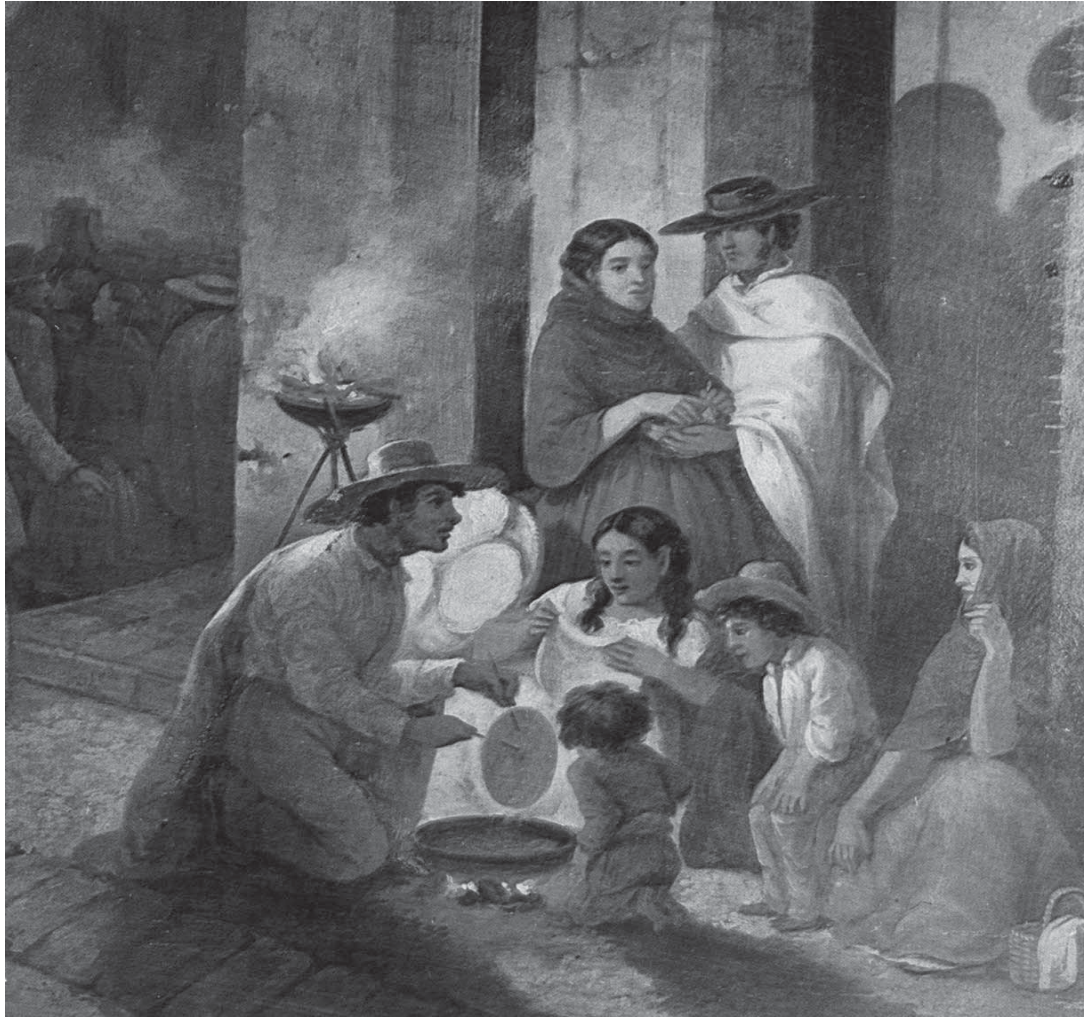
Familia mexicana, cuadro del siglo XIX.