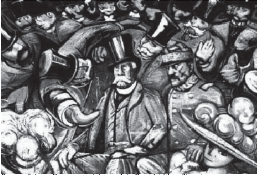
Paz porfiriana. Fragmento del mural de David Alfaro Siqueiros.

la justicia, lejos de proteger al débil, legalizaba los atropellos cometidos por el fuerte; los jueces, en lugar de enaltecer los fines de la justicia, servían fielmente a los intereses del Ejecutivo; las cámaras de la Unión no tenían otra voluntad que la del Dictador; los gobernadores de los Estados eran designados por él, y ellos a su vez, nombraban a las autoridades municipales... Así, todo el engranaje del poder, obedece al capricho del General Porfirio Díaz, quien en su larga administración, antepone a cualquier otro interés, su ambición individual, a toda costa. La propiedad privada se encontraba en unas cuantas manos de latifundistas. 10 En materia laboral, aplicaba el principio de la autonomía de la voluntad, sujetando al trabajador a la explotación de su patrón, quien se creía totalmente libre de fijar las condiciones de la jornada, haciéndola totalmente inhumana y con un salario exiguo. Esto, entre otras circunstancias, creó el gran estallido social.