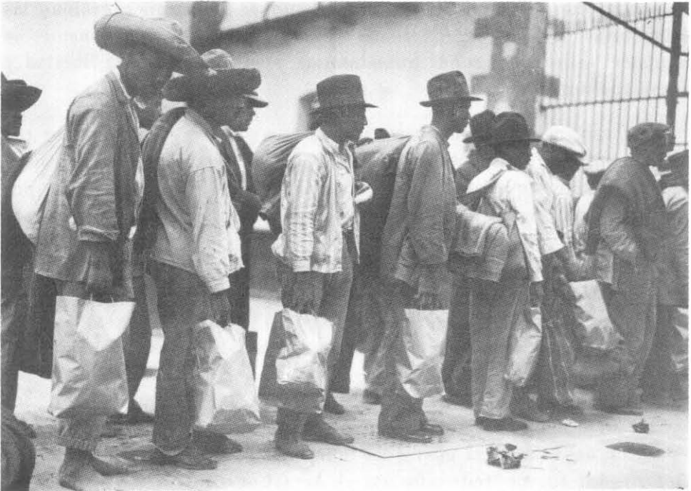
México se ha distinguido dentro de la comunidad internacional, especialmente latinoamericana, como país de asilo seguro para los perseguidos políticos