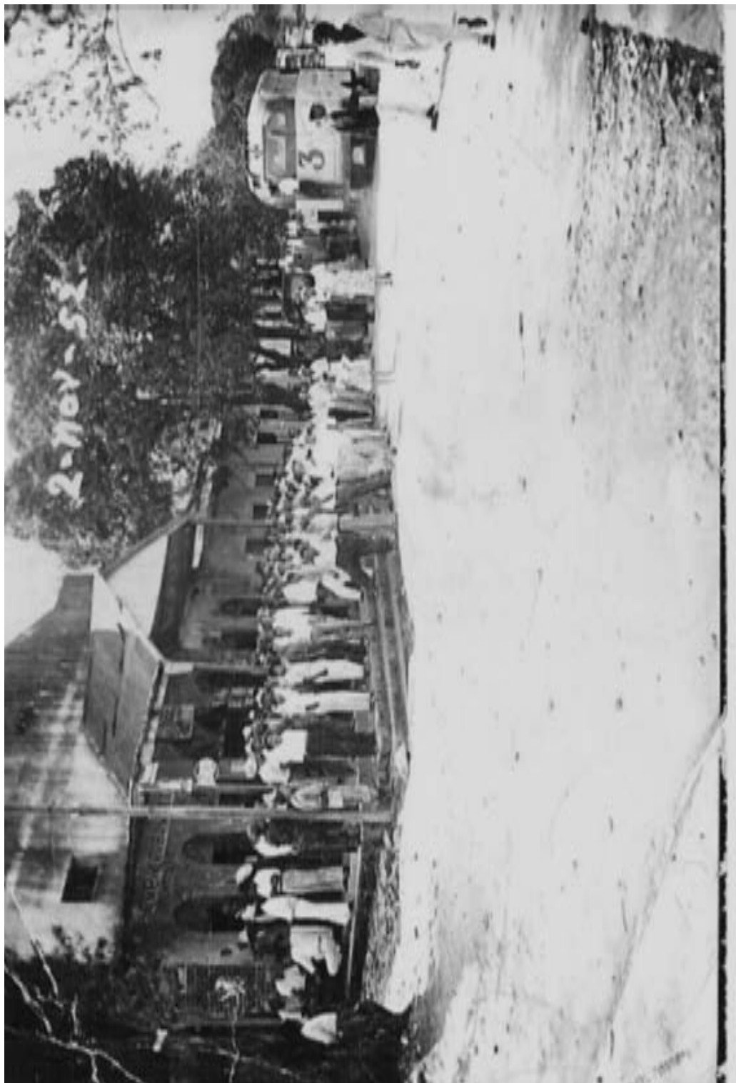
Día de elecciones en Matías Romero, Oaxaca [2 de noviembre de 1952].