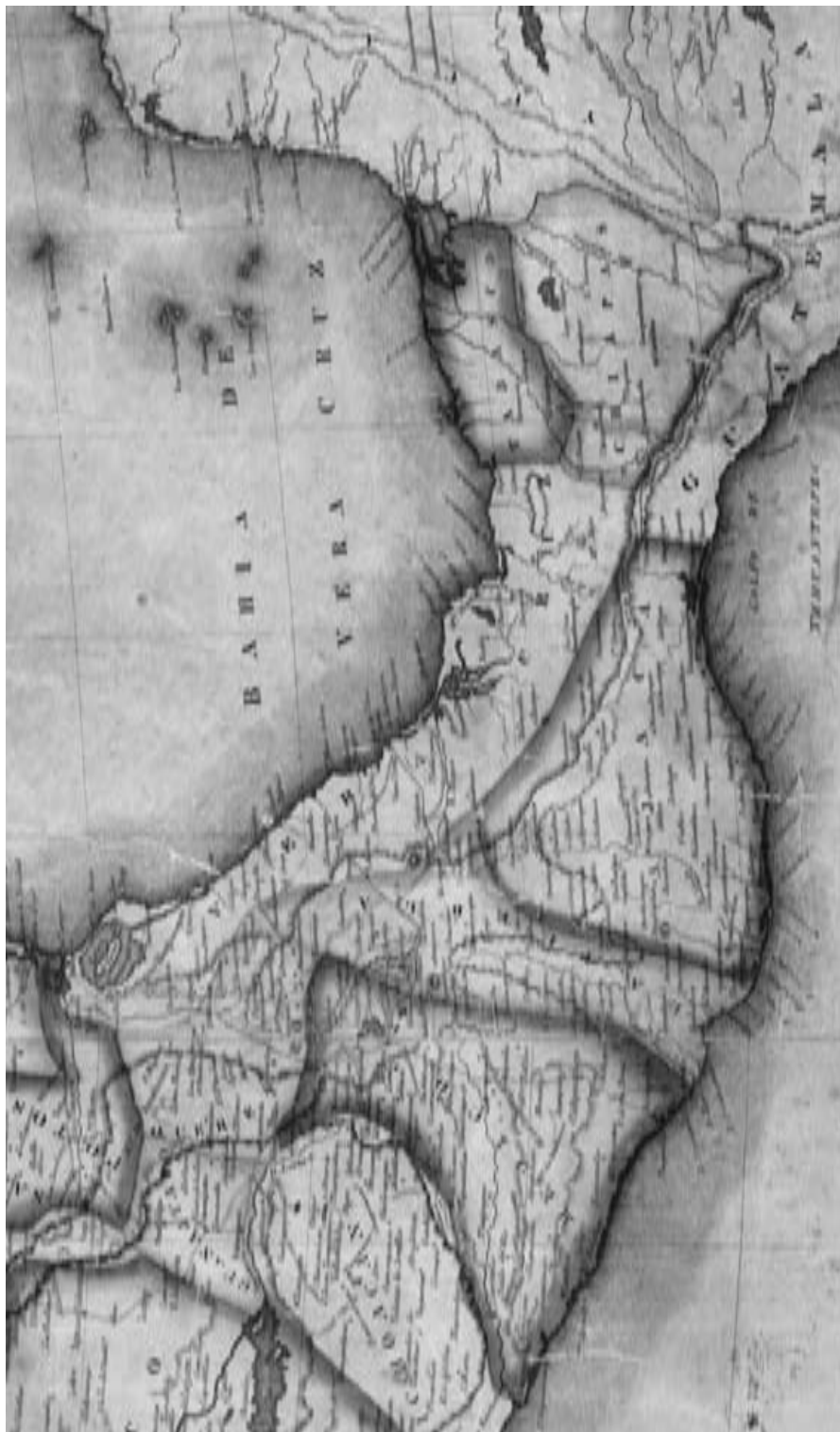
"Oaxaca", fragmento del Mapa de los Estados Unidos de Méjico, 1828, Mapoteca "Manuel Orozco y Beira", Colección General, Varilla CCRM06, 7751-CGE-7216-A (Varilla de Visitas), 77x110 cm.