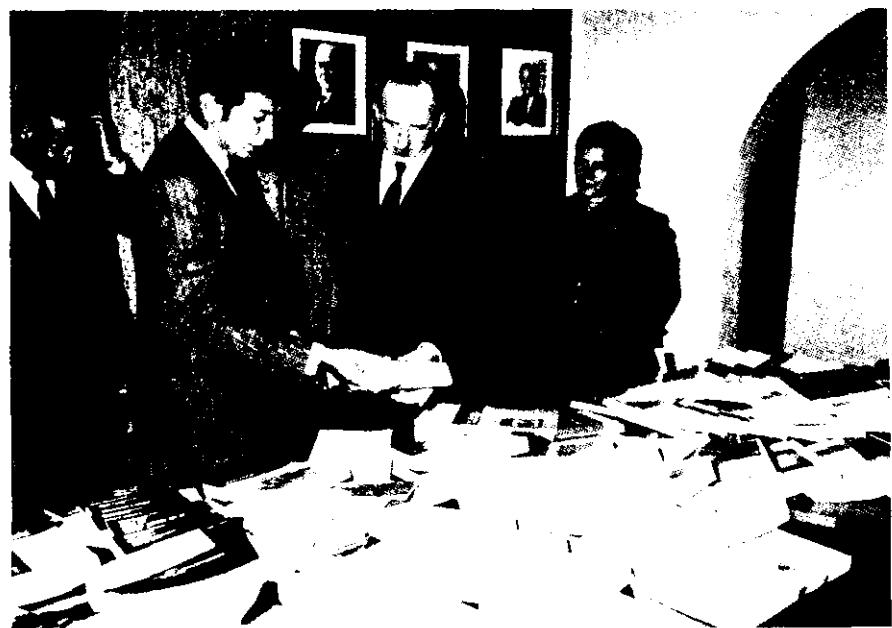
Anicet Le Pors en su visita al Institut